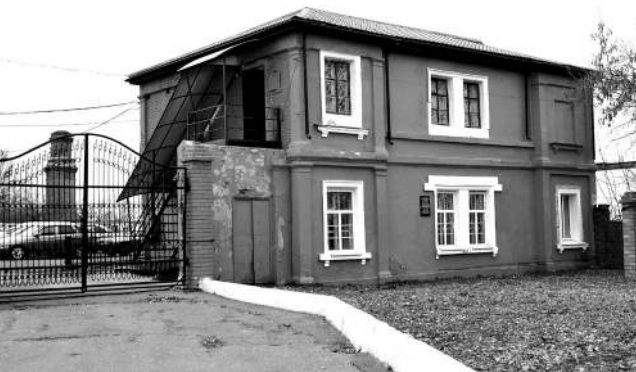
В этом здании с 1897-го по 1918 г. располагалась Оренбургская учёная архивная комиссия.