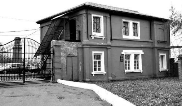
В этом здании с 1897-го по 1918 г. располагалась Оренбургская учёная архивная комиссия.