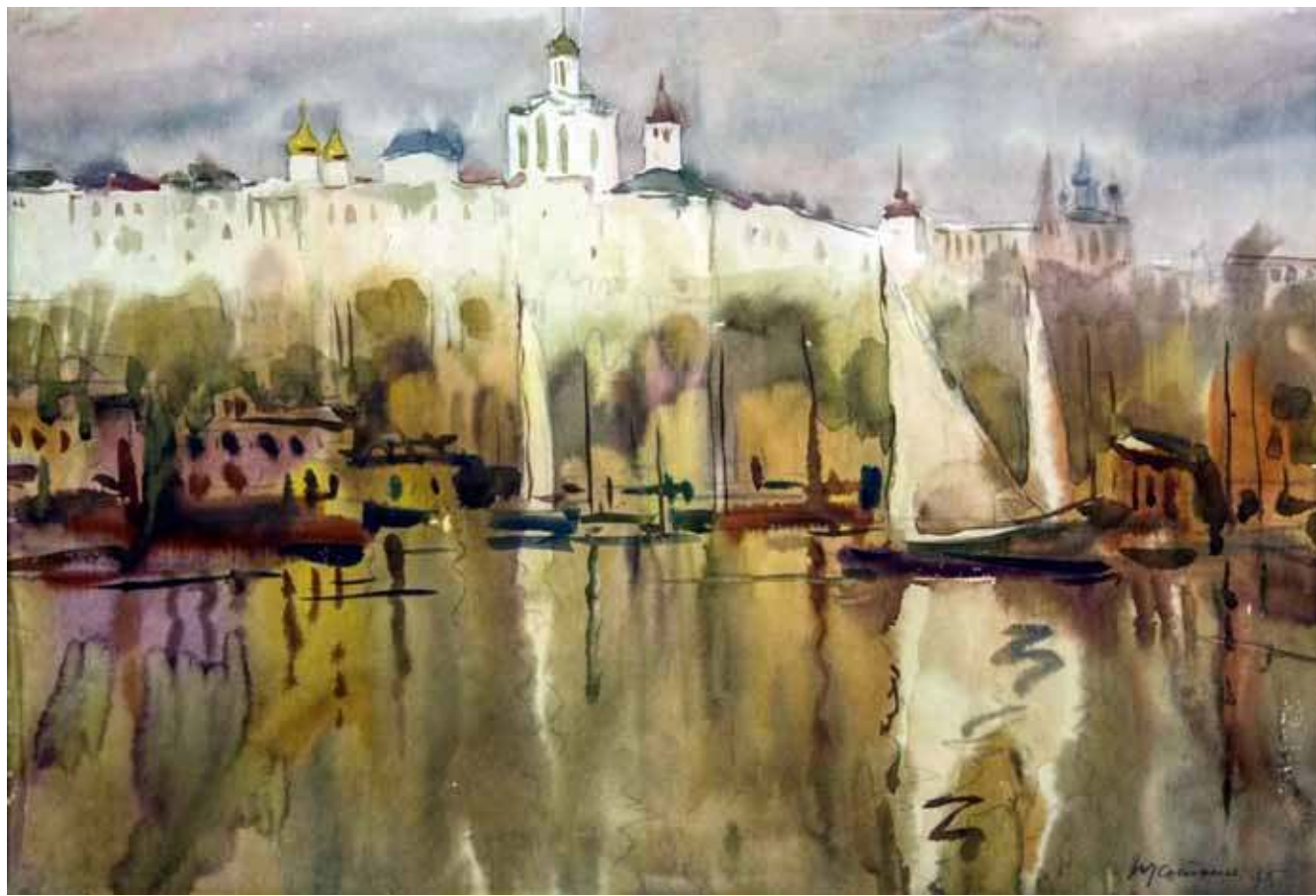
Алексей Югаткин. Русский город . 1975. Бумага, акварель. 38х55. Собственность ГХМАК

души», — художник любил повторять эти слова Константина Коровина.