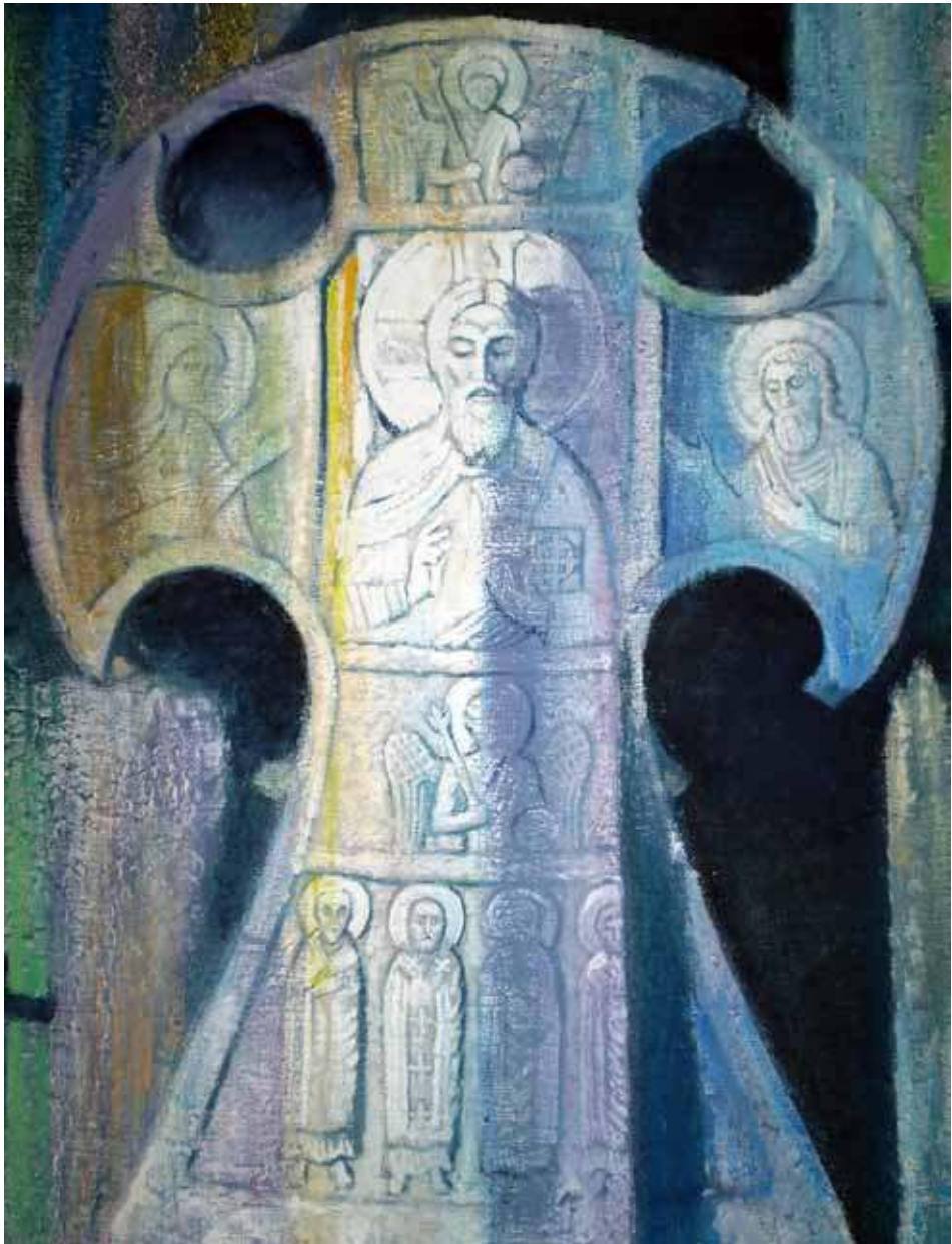
Илзе Рудзите. Свет . 2015.

Государственный музей истории литературы, искусства и культуры Алтая