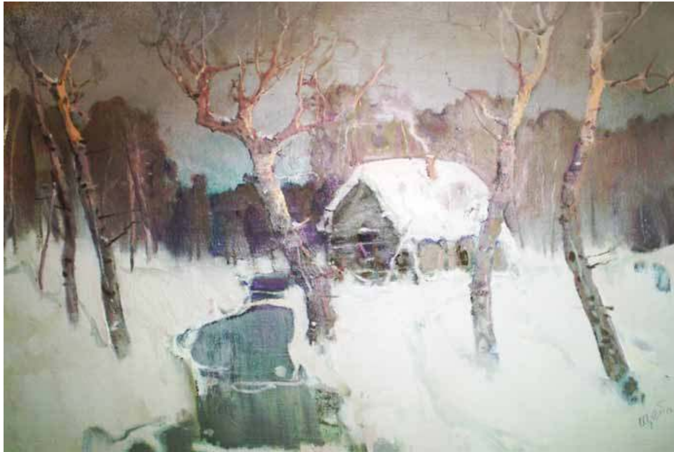
Анатолий Щепланов. Рассвет .