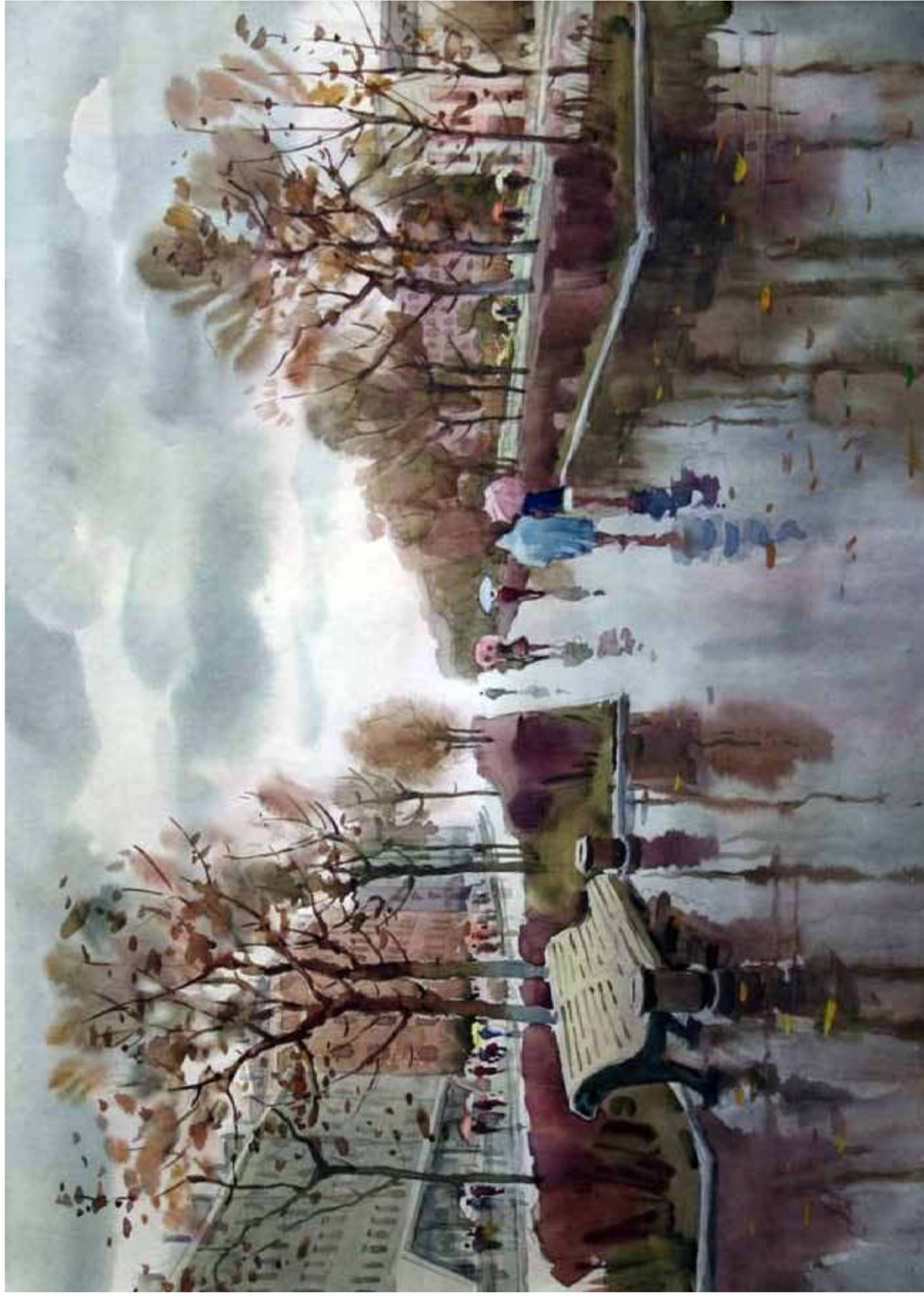
Алексей Югатов. Проспект Ленина после дождя. 1978. Бумага, акварель. 52,5x73. Собственность ГИМАК