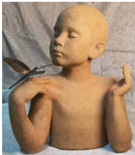
Людмила Рублёва. Данилка. 1975. Жесть, медь, шамот. Собственность ГХМАК