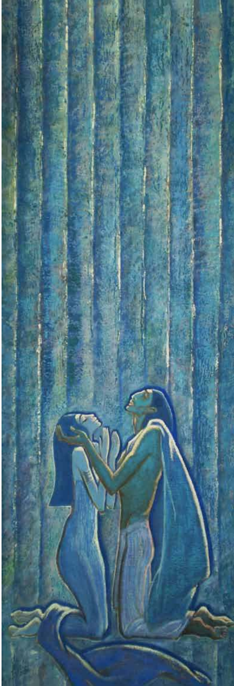
Илзе Рудзите. Радамес и Аида. Древнеегипетская легенда. 1974. Собрание ГХМАК.

Многочисленные картины-композиции Илзе Рудзите посвящены проявлениям любви как земной (любовь мужчины и женщины, любовь матери и дитя), так и небесной.