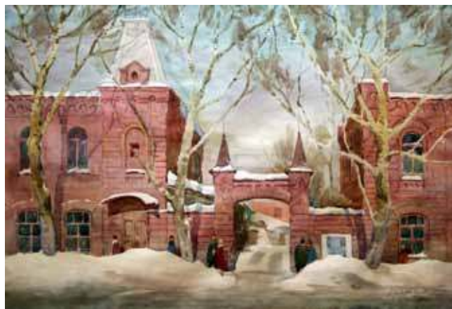
Алексей Югаткин. Старый Барнаул . 1979. Бумага, акварель. 49х72. Собственность ГХМАК

Рядом с залом акварелей Югаткина — почти три десятка его натюрнсов работ. Они специально были оформлены сыном художника, Евгением, к выставке в музее. Этюды для художника были своеобразными записными книжками. Они хранили конкретные образы и мотивы, отражали его мысли и переживания. Этюдник Югаткина, служивший ему долгие годы, тоже вошел в экспозицию, инсценирующую уголок мастерской: мольберт, старые очки на резинке, кепка, рисунок карандашом, кисти, брошенные на палитру, тюбики с красками. Кажется, художник только что вышел.