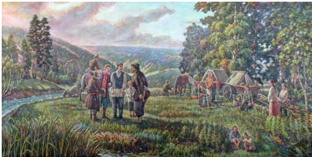
Георгий Селянин. Переселение в Сибирь . 1992. Холст, масло. 105x200