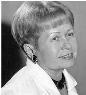
Александра ПАХМУТОВА, народная артистка России, композитор:

Когда мы говорили об Иване Васильевиче Грозном, что он собирал все эти пространства и включал в русскую державу татар, ливонцев, прибалтов, у меня сразу возник образ храма Василия Блаженного. Ведь этот храм построил царь. И этот храм, с одной стороны, является символом русского рая, а с другой стороны – символом русской державности. Посмотришь на него и видишь, что там сидит татарин с пиалой, там сидит тюрк, там сидит русский воин. Я думаю, что этот союз хоров, союз народов, союз этих культур, союз представлений каждого народа о небесном, о высшем, о недостижимом, воплотился и в храме Василия Блаженного, и в Кубанском казачьем хоре. В начале я сказал, что Кубанский казачий хор – Эрмитаж, Байкал и Волга, а сейчас скажу, что он еще и храм Василия Блаженного.