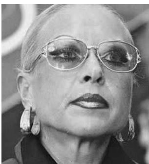
Александра ПЕРМЯКОВА, художественный руководитель Государственного академического русского народного хора им. Пятницкого, народная артистка России:

— Кубанский казачий хор — величайшее наше достояние, неотъемлемая часть культуры России. В тяжелейший момент русской истории именно казаки до конца оставались верными присяге, служению своему Отечеству. И то, что составляет сегодня искусство Кубанского казачьего хора, — это не просто фольклор, не просто песни, танцы. Это сохранение духа казачьего в нашей стране. Причем не в застывшей форме, а в развитии. Растут дети, и для них казачья энергия — не просто лампасы, нагайки, усы и лихость, но корневая система, традиции преданного многовекового служения своему народу.