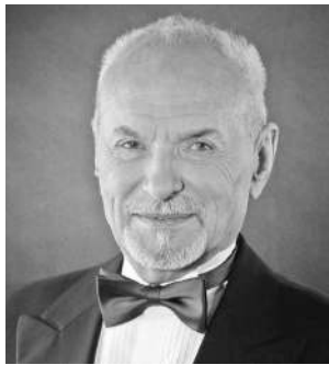
Владимир МИНИН, художественный руководитель и главный дирижер Московского государственного академического камерного хора, народный артист СССР, профессор:

— Высокая миссия — нести народу духовность и нравственность, которых так не хватает сейчас в обществе и так мало на нашем телевидении и радио, где народная песня попала под определение «неформат». Но такое живое искусство — горячее, искреннее, жизнерадостное — в душах народа всегда найдет отклик, как нашло его в душах сотен ребят — выпускников школы Кубанского казачьего хора.