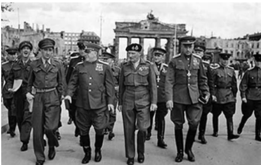
Парад союзников в Берлине. 7 сентября 1945 года