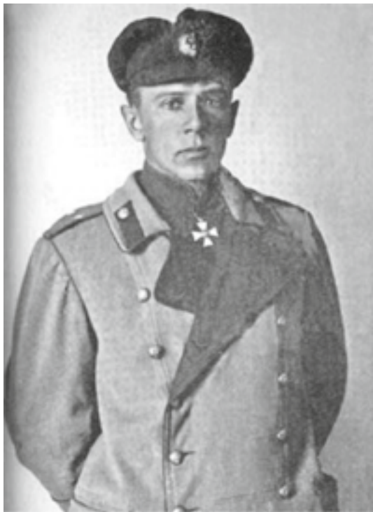
Генерал-майор Белой армии С. Н. Войцеховский (1918 год)

С первого дня Первой мировой войны С. Н. Войцеховский на фронте, где проявил себя храбрым и умеющим думать тактически и стратегически офицером, что нашло своё отражение в полученных им в короткое время наградах — орденах Св. Анны, Станислава с мечами и лентой, и даже ордена Св. Владимира с мечами и бантом, которыми награждались лишь офицеры, выдержавшие бой под угрозой смерти. В конце