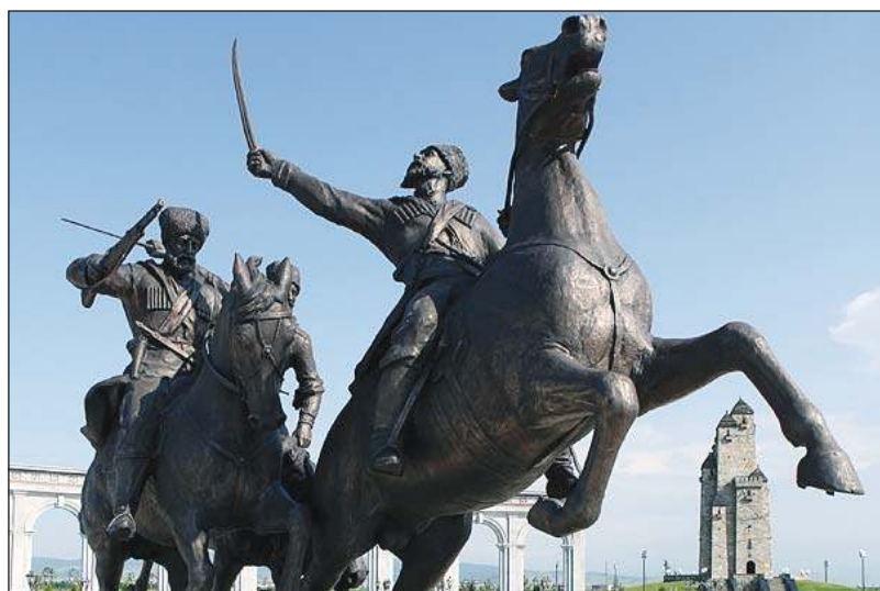
Памятник бойцам ингушского полка Дикой Дивизии в Назрани