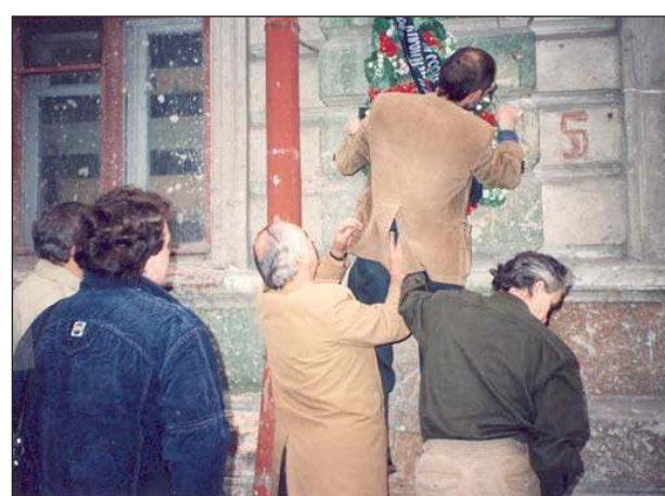
Автор статьи прибывает первый венок в сентябре 1991 г.