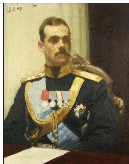
Великий князь Михаил Александрович Романов (22.11/(5.12) 1878 г. — 12.06 1918 г.) Портрет Михаила кисти Репина