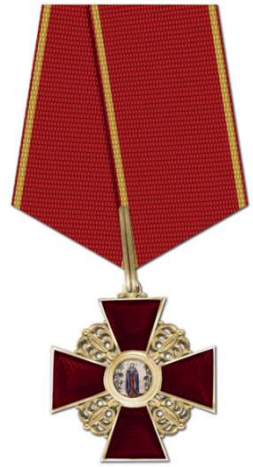
Орден Св. Анны 3-й ст.