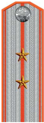
Губернский секретарь (помощник участкового пристава)