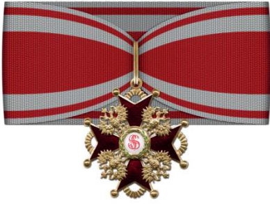
Орден Св. Станислава 2-й ст.