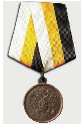
Темно-бронзовая медаль за усмирение Польского мятежа 1863–1864 гг.