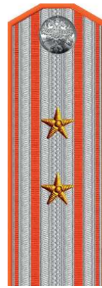
Коллежский ассессор (частный или становой пристав)