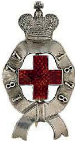
Знак Красного креста