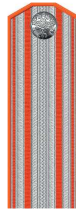
Коллежский советник (исправник)