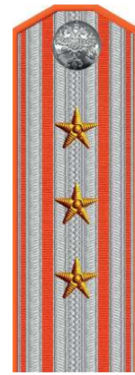
Надворный советник (помощник исправника)