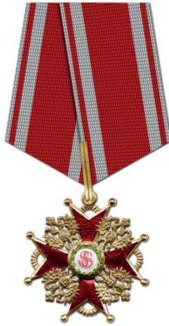
Орден Св. Станислава 3-й ст.