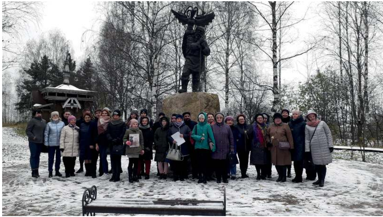
Участники Клюевских чтений у памятника поэту

Сергей Есенин, Сергей Клычков, ещё некоторые авторы. Да и в определённой мере и сам Александр Александрович Блок, которого привлекало в Ключеве то, чего самому не хватало – цельное православно-мировоззрение.