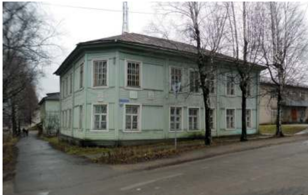
Вытегра музей Клюева

Дмитриевна – сказительница, плакальница, знавшая и фольклор, и церковные песни, и народные обычаи.