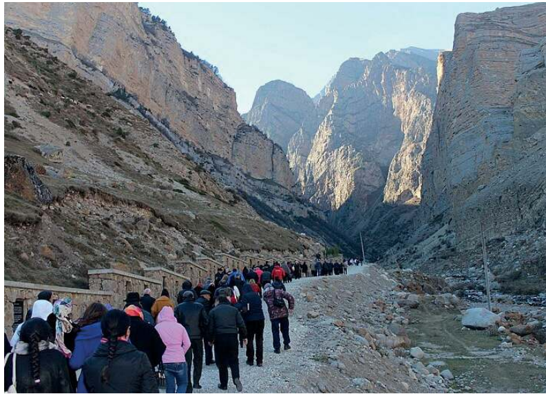
Мемориальный комплекс на родине поэта в селе Верхний Чегем

Кайсын Кулиев впитал в себя культуру Востока, традиции русской и мировой классики. Близкими для себя по духу и творчеству поэтами Кулиев считал Пушкина, Лермонтова, Тютчева, Низами, Физули, Пастернака, Твардовского, Байрона, Верхарна, Лорку и других. «Мировая поэзия дала мне ту культуру, без которой и вне которой поэтом стать нельзя» , – говорил он. Строки из его стихотворений стали крылатыми: