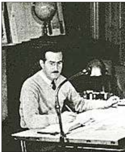
М.П. Арцыбашев в редакции газеты «За Свободу!».

За время, прошедшее с выхода первых публикаций литератора, его творчеству было посвящено 146 книг и крупных статей, не говоря уже о бесчисленном множестве информационно-обзорных упоминаний.