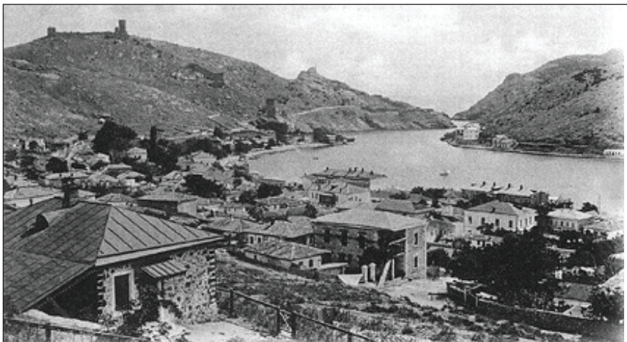
Дом Г.Ф. Арони в Балаклаве.

С тех пор этот тихий городок прочно вошел в жизнь писателя. Хотя поначалу все складывалось непросто. После многочисленных