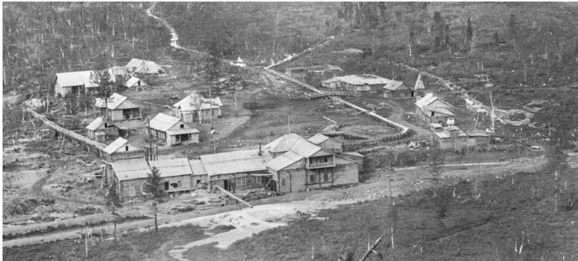
Панорамный вид на жилые помещения завода «Рассвет». Фото 1890-х гг.