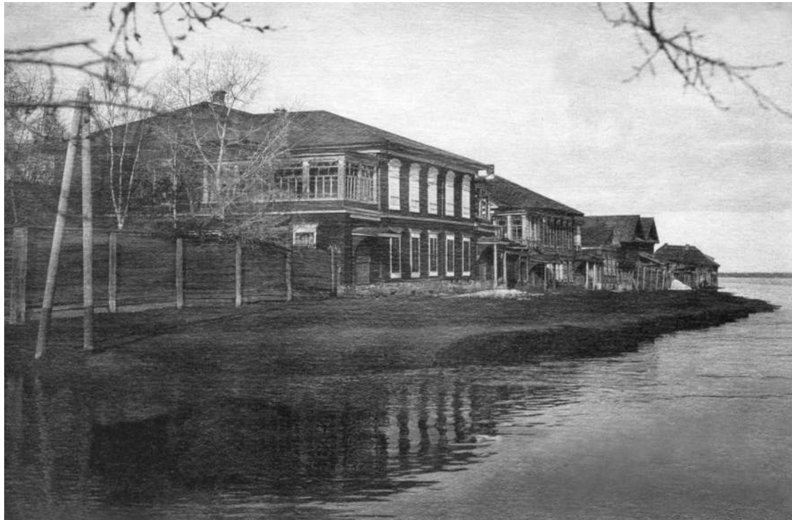
Вид на дом усадьбы Базилевских в Енисейске. Фото 1937 г.

32 коп.— сумма, которую тратит иной домовладелец на ремонт своей усадьбы» 44 .