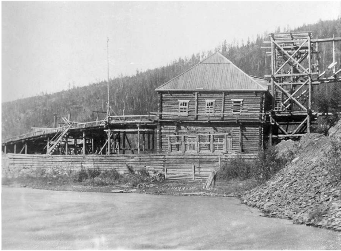
Вид на завод «Рассвет». Фото 1890-х гг.