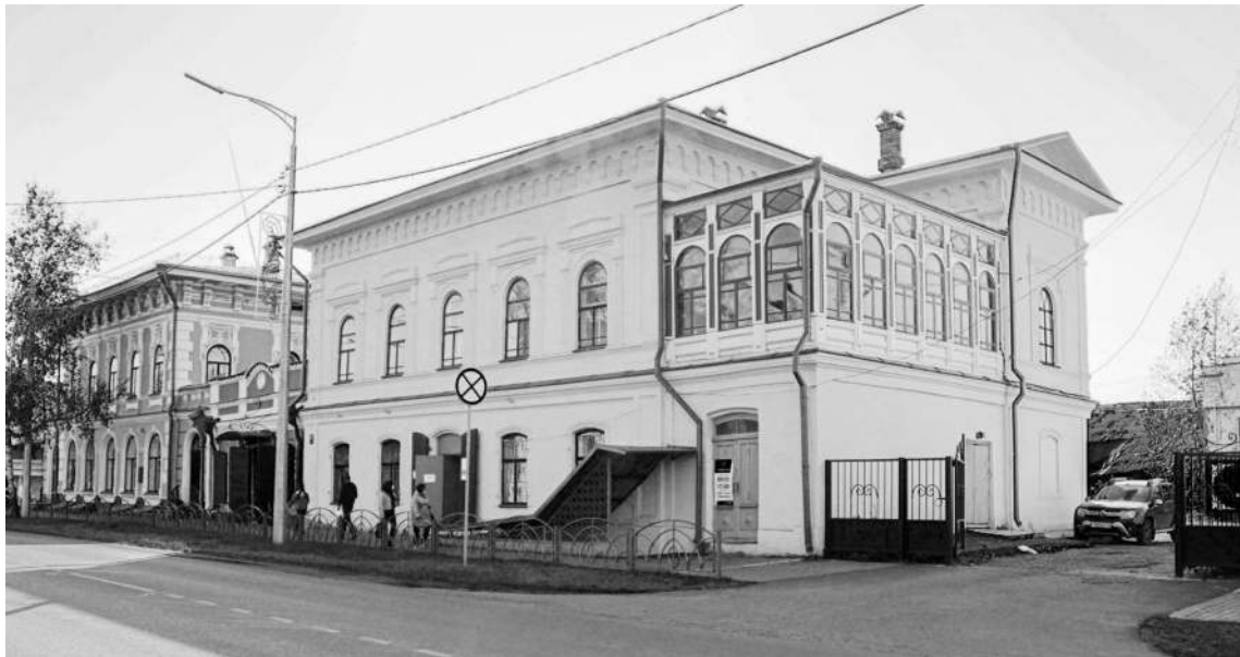
Дом Фунтосова—Захарова (справа) на ул. Ленина. 2020 г.

Фоминской—четыре тысячи рублей 4 . Упоминались и другие родственники, которым полагалась часть капиталов почившего купца.