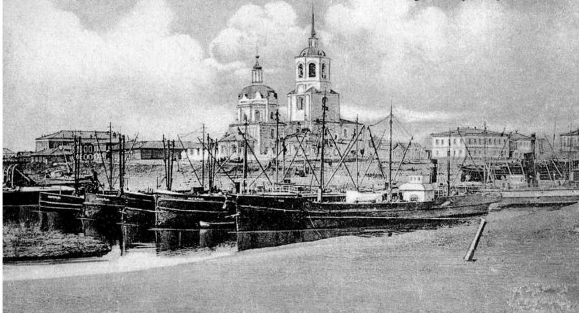
Енисейская казённая флотилия. Открытка 1903 г. Справа — дом Фунтосовых