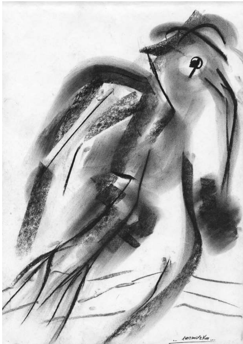
Рисунок Всеволода Шмакова «Ласточка»