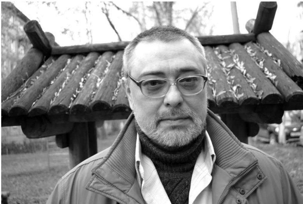
Всеволод Шмаков. Фото Андрея Коровина, 2013