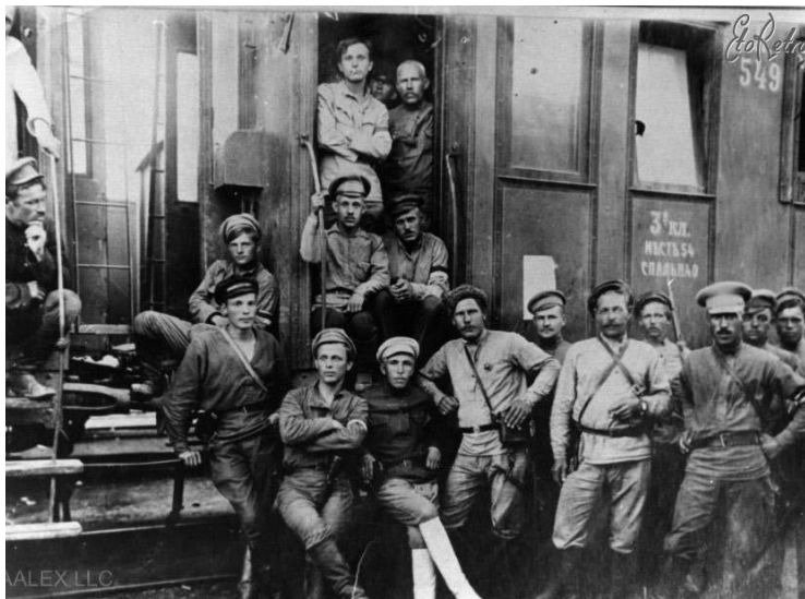
Красноармейцы Казанского отряда, отправляющиеся на Оренбургский фронт.

дальше они не хотели. Появились призывы расходиться по домам и спокойно восстанавливать своё порушенное хозяйство. Проведение мобилизации казаков в этих условиях было затруднительным. Дело дошло даже до того, что военная комиссия Оренбургского войскового Круга в сентябре 1918 года рассматривала вопрос об амнистии казаков, воевавших на стороне Красной Армии и разрешить им вступать в свои части. Эта идея Кругом была отвергнута. Более того, было принято решение об исключении из казачьего сословия лиц, воевавших на стороне большевиков. Уклонение от мобилизации приобрело катастрофический характер. Массово дезертировали или даже переходили на сторону красных казаки станиц Краснохолмской,