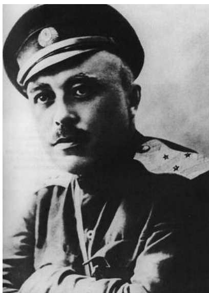
А.И. Дутов (1879—1921)

Только через неделю революционный произвол в городе стал стихать. Всю полноту власти в губернии (точнее той её части, что признала советскую власть) взял на себя воссозданный Военно-революционный комитет. Стремясь договориться с большевиками, Оренбургское земское собрание и целый ряд казачьих станиц