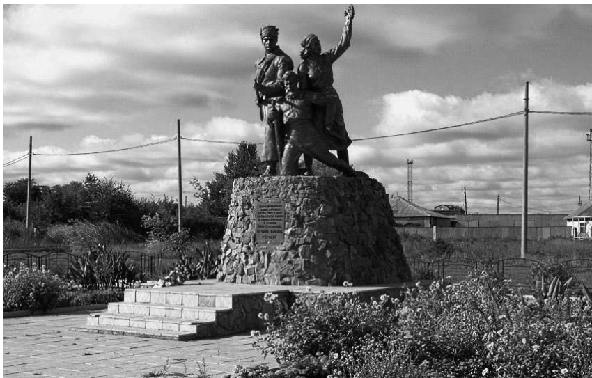
Памятник на братской могиле 89 красногвардейцев 3-го бузулукского полка, погибших на станции Новосергиевская в 1918 году в боях с дутовцами.

20 марта 1919 года на заседании СНК было принято решение утвердить автономию Башкирской республики. В тот же день ВЦИК утвердил «Соглашение Центральной Советской власти с Башкирским Правительством о Советской автономии Башкирии». В Соглашении определялось, что АБСР образуется в пределах Малой Башкирии и составляет федеративную часть, входящую в состав РСФСР. Территории, непосредственно образующие республику, определялись путём выделения волостей из уездов: из Оренбургского уезда было выделено 17 волостей, из