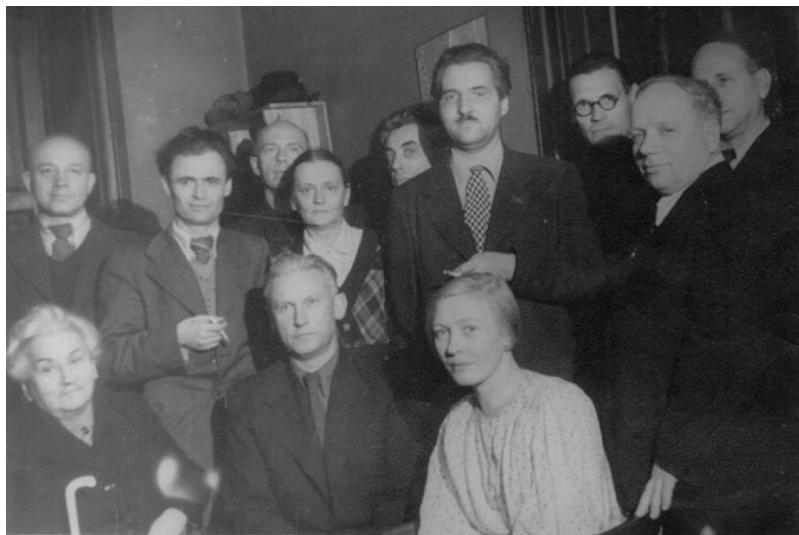
О.Берггольц с А.Фадеевым, К.Симоновым, А.Прокофьевым и другими писателями в 1946 году

Но даже тем, кто всё хотел бы сгладить в зеркальной, робкой памяти людей,