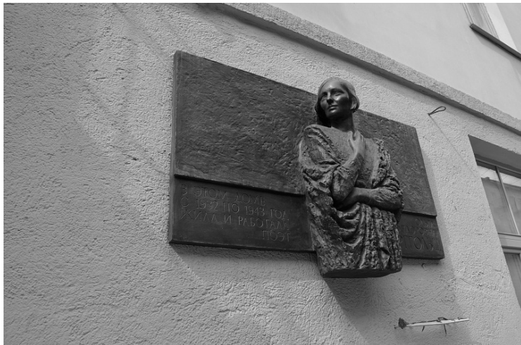
Мемориальная доска в память о поэтессе

не дам забыть, как падал ленинградец на жёлтый снег пустынных площадей.