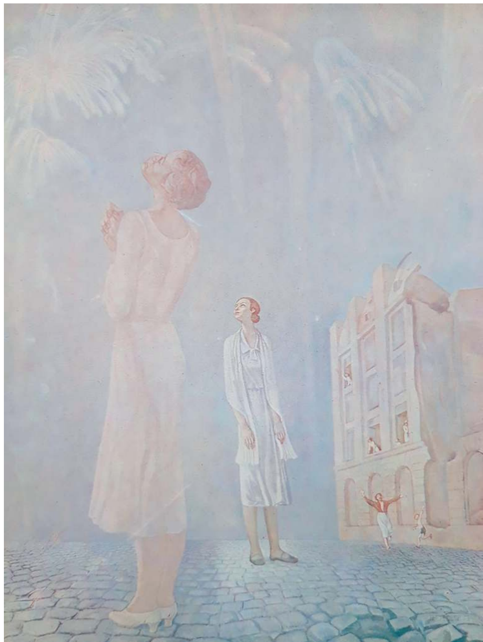
«Салог», 1973 год