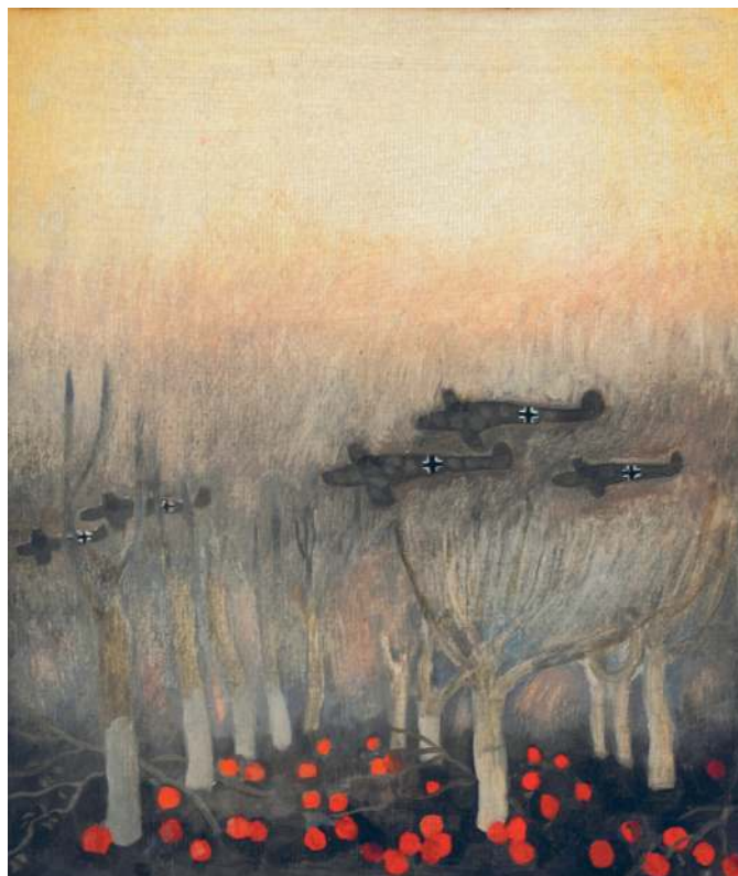
«Яблоки». Эскиз, 1974 год