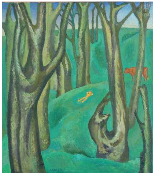
Из моего детства. Триптих. «Развалины», 1969 год