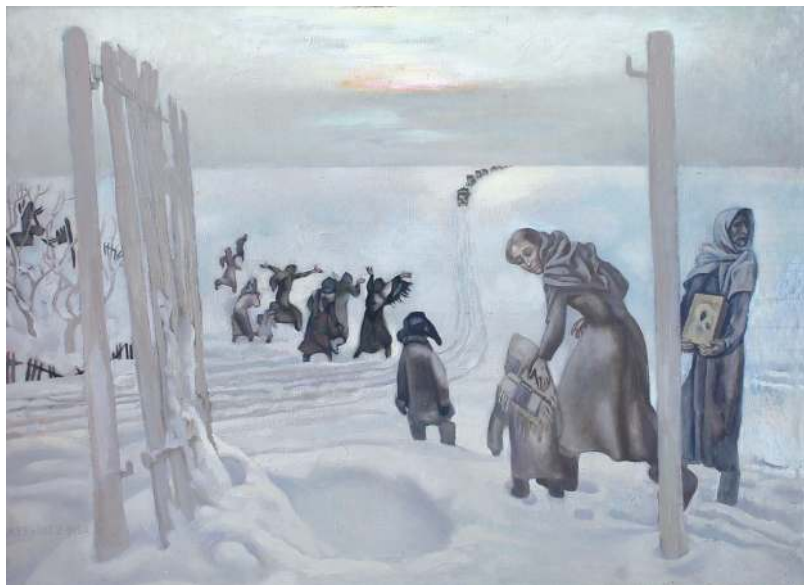
Из детства. Триптих. «Освобождение», 1985 год