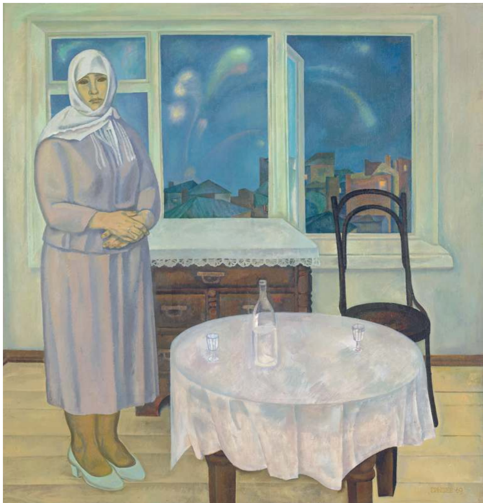
«Май сорок пятого», 1969 год