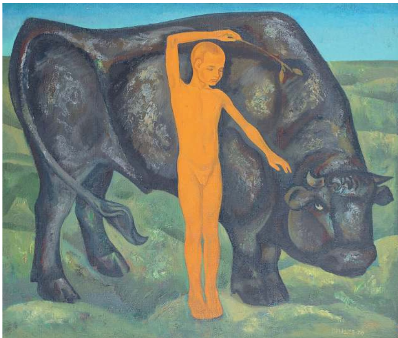
Из моего детства. Триптих. «С быком», 1969 год