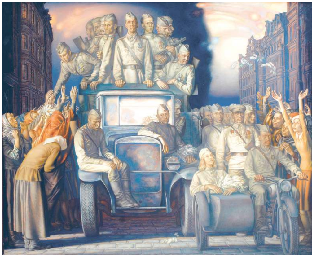
«Возвращение», 1988 год