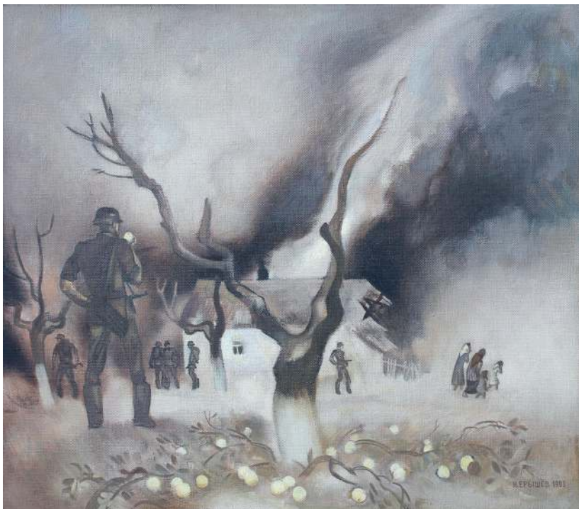
Из детства. Триптих. «Оккупация», 1985 год