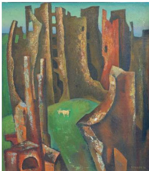
Из моего детства. Триптих. «Из моего детства», 1969 год