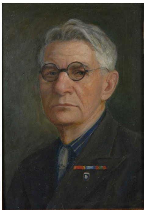
Автопортрет. 1963 г. К., м