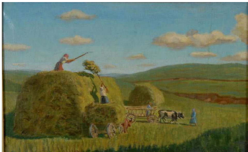
Сенокос. 1942 г. Холст, масло. 45x71