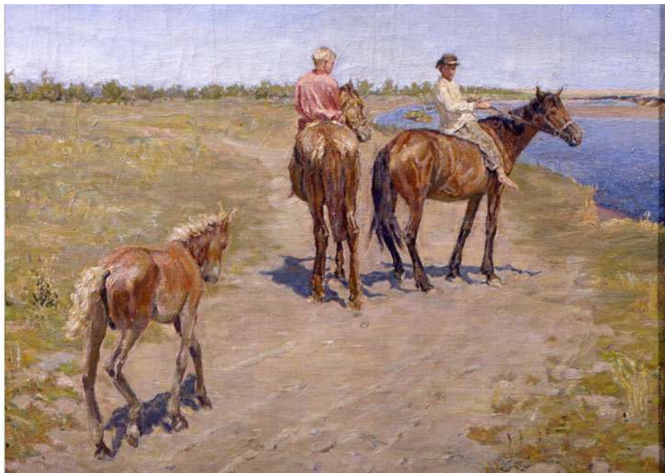
Лошадки в степи. 1930-е гг. Х.,м