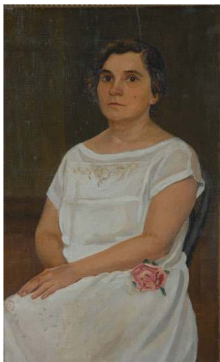
Портрет жены в белом платье. 1940-е. 85x56