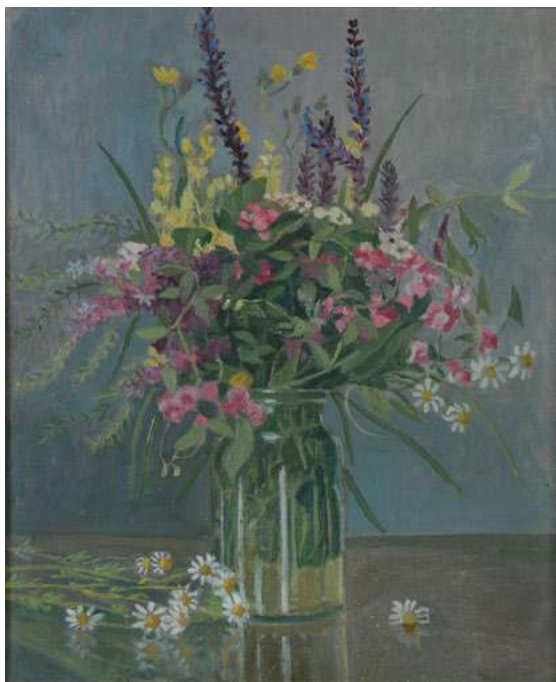
Полевые цветы. 1960-е гг. Х., м. 57x42