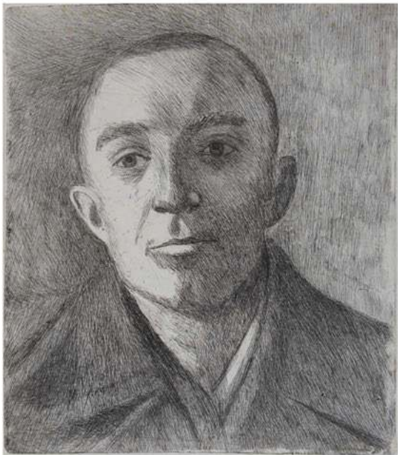
Портрет сына. 1970-е гг. Б., офорт