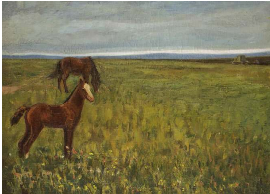
Весенняя степь. 1960-е гг. Холст, масло. 51,3x67,8