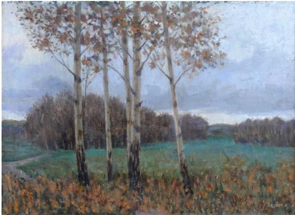
Хмурый вечер. 1951 г. Х.,м