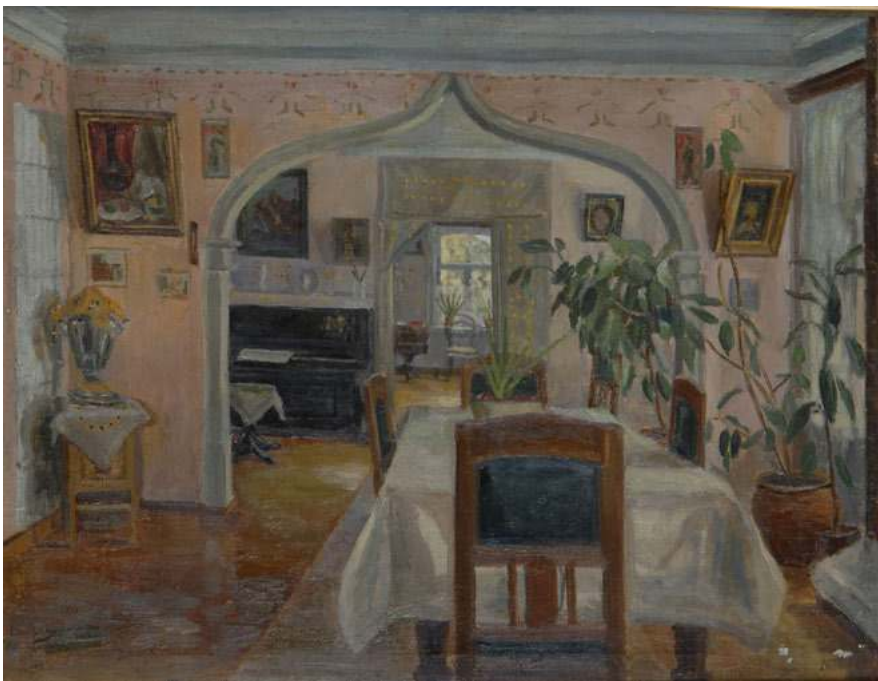
Интерьер. 1946 г. Х., м