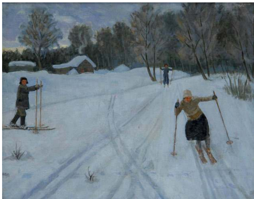
Катание на лыжах. 1930-е гг. Х.,м