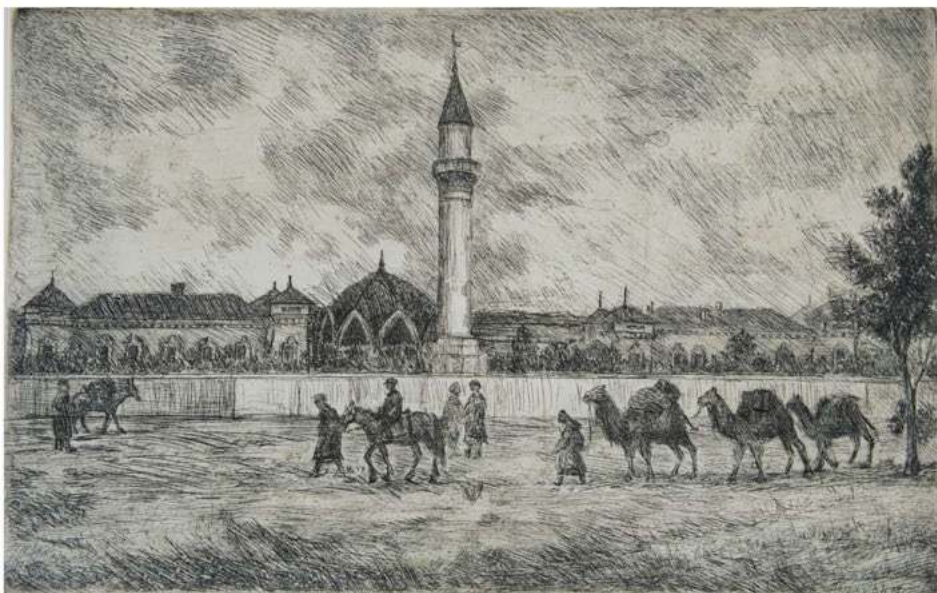
Из прошлого Оренбурга. 1970-е гг. Б., офорт