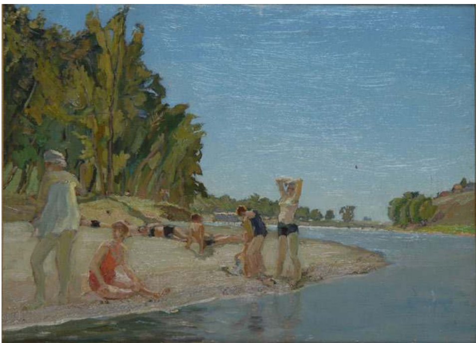
На пляже. Этуд. 1936 г.