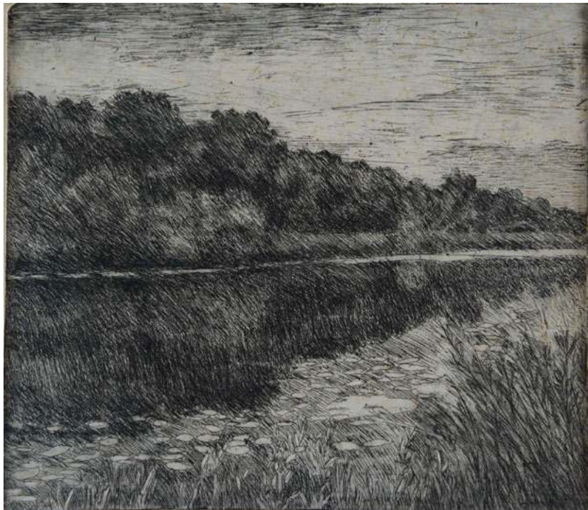
Озеро. 1970-е гг. Б., офорт