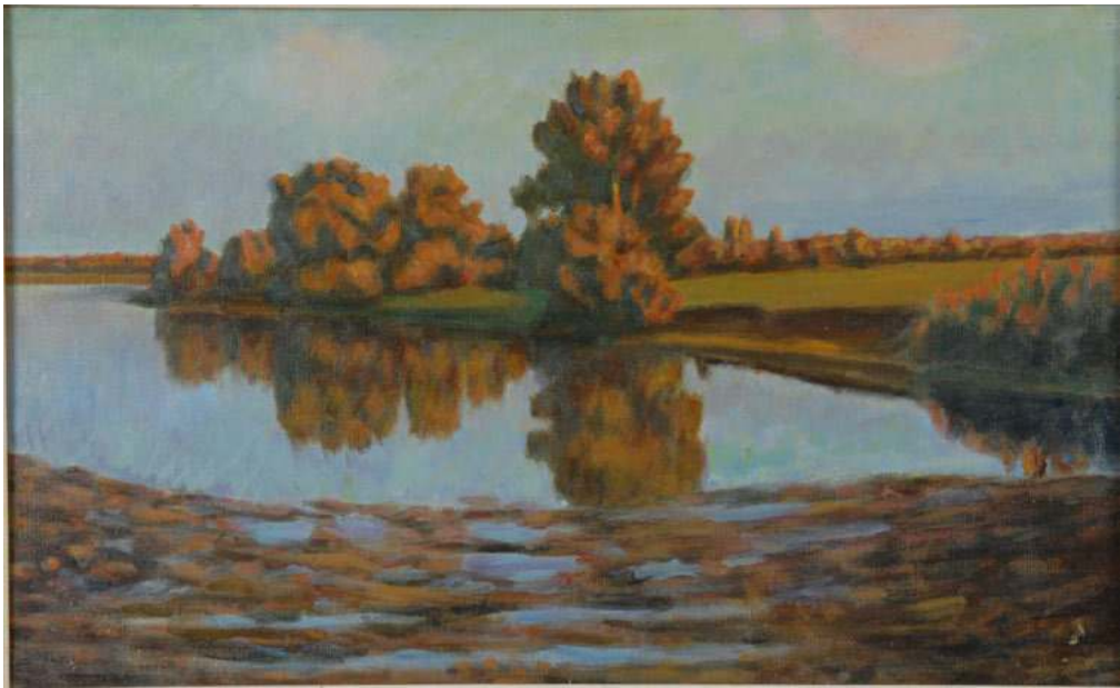
Вечер. После дождя. Конец 1960-х. Х.,м