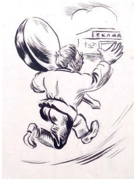
Серия карикатур «Современные типы». «Крестьянская газета», 1938 г.