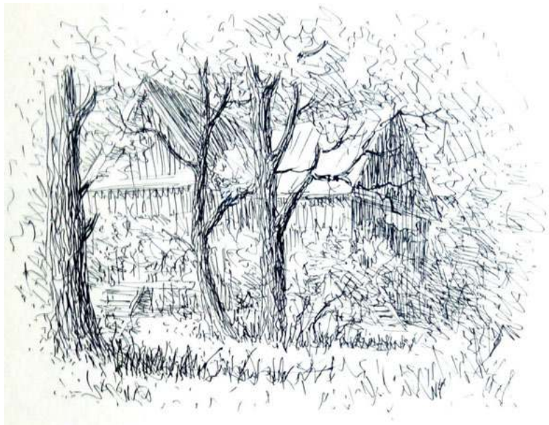
Городская зарисовка. 1969 г.