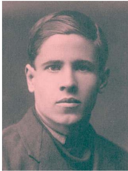
Варламов С.А. Автопортрет (1968 г. Тушь, перо) и фотография 1930-х годов