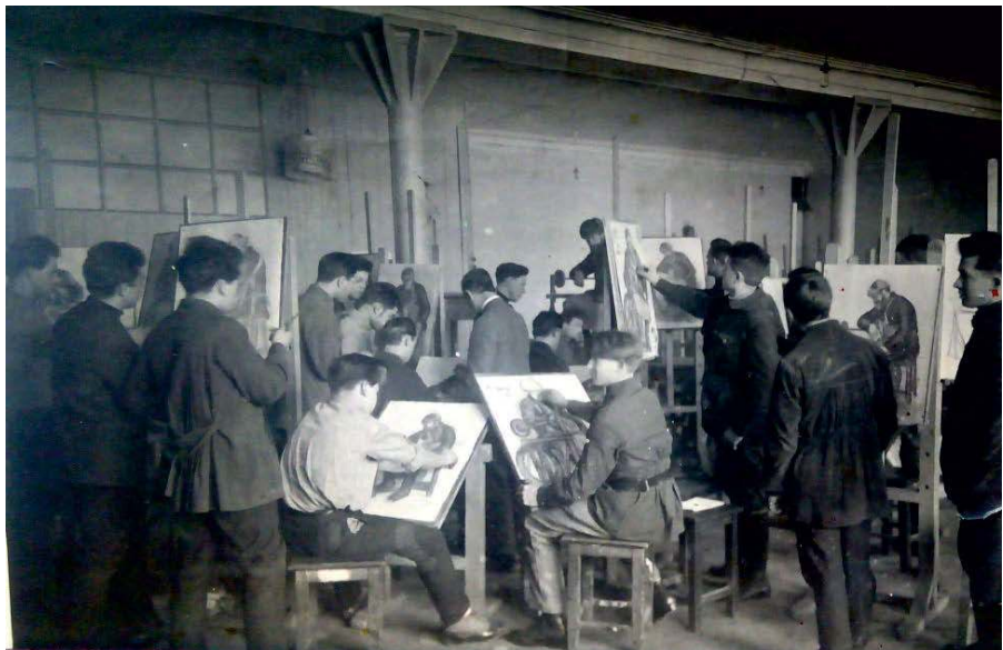
Рабфак искусств 1930-х годов