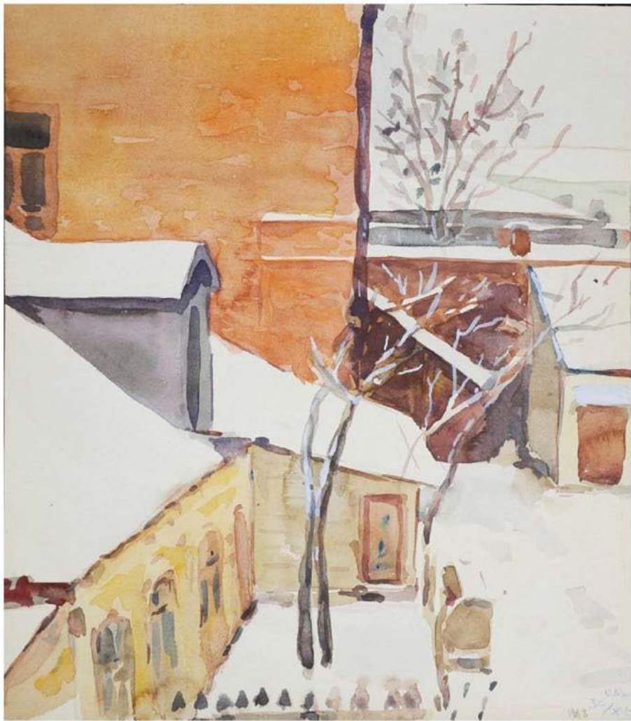
Вид из окна. Оренбург. 1968 г.