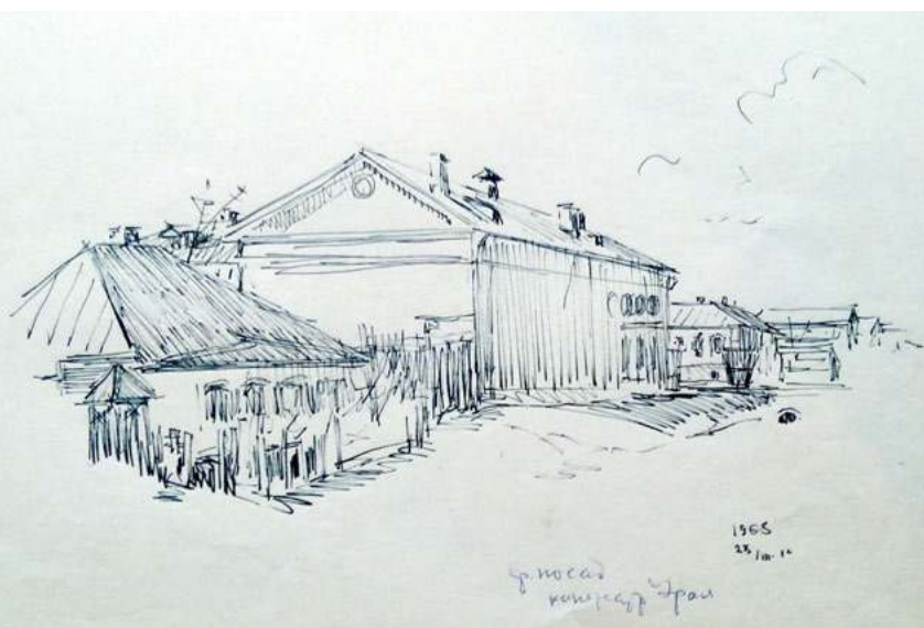
Красный посад. Кинотеатр «Урал». 1965 г.