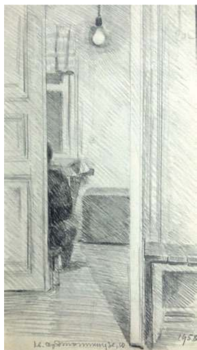
Квартира на Орджоникидзе. 1958 г.