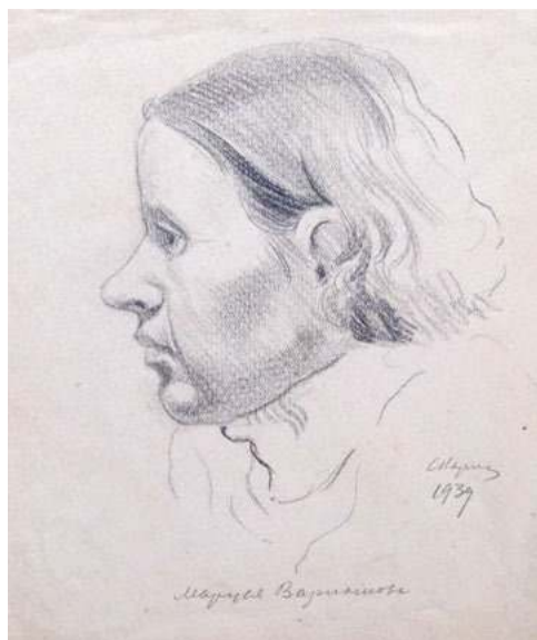
Портрет 1939 г.