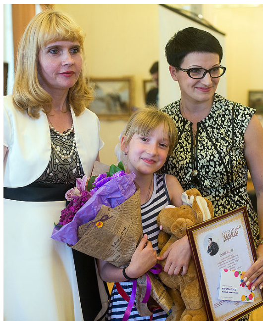
Подарки авторам "Гостиного Дворика"