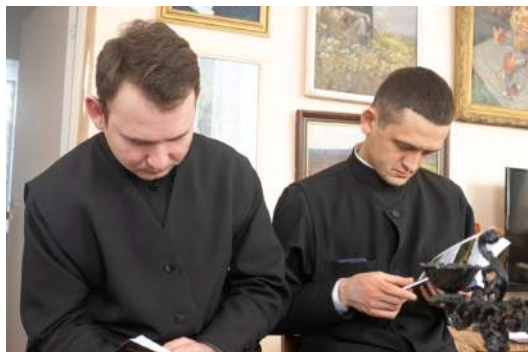
Семинаристы читают "Гостиный двор"