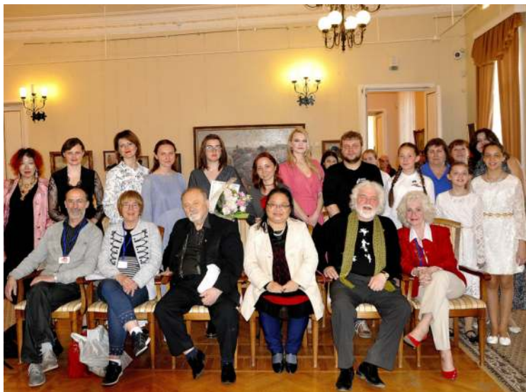
С иностранными гостями в областном музее изобразительных искусств