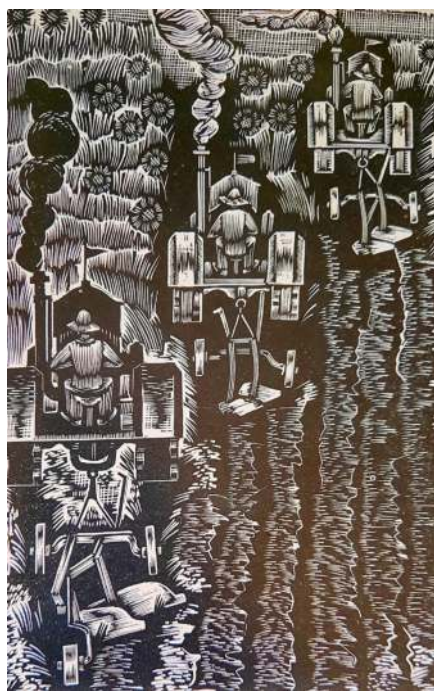
«По равнине ползут друг за другом три трактора». Из серии «Колхоз». 1930. Ксилография. 15,3x9,9