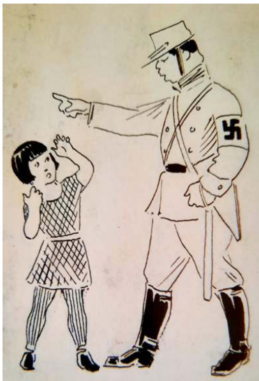
Девочка и фашист. Рисунок для газеты «Сталинские внучата». 1936. Б., тушь, перо. 9х6,4