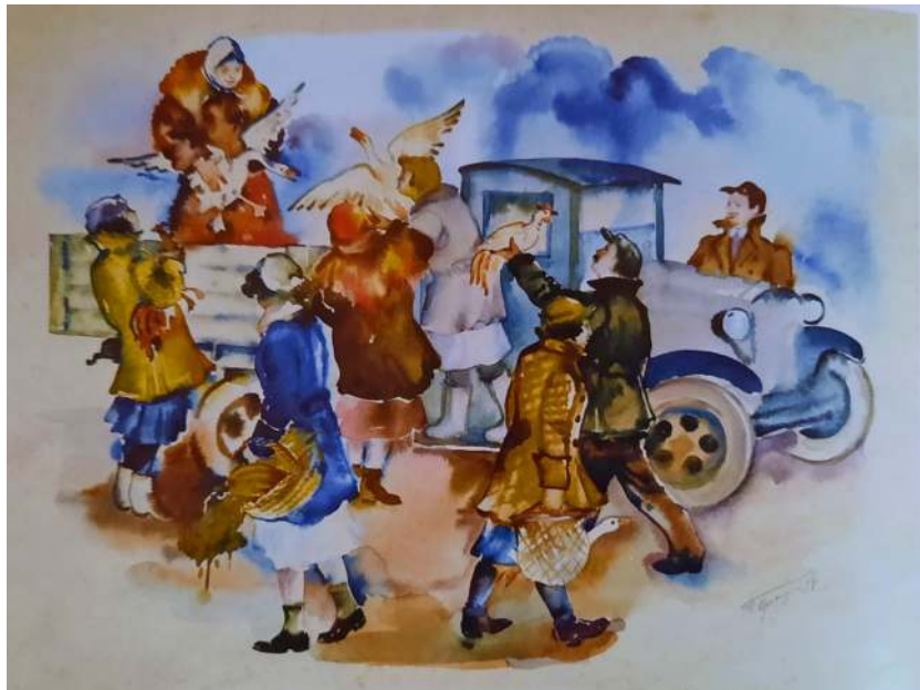
На оренбургском базаре. 1938. Б., акв. 45x50