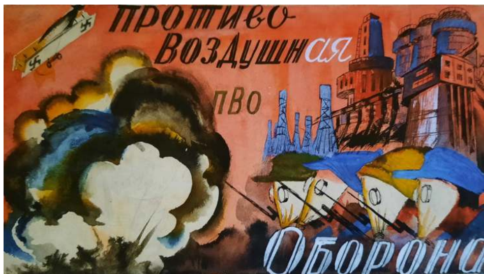
Иллюстрация к книге о противовоздушной обороне. 1930-е. Б., акв., гуашь, тушь. 6,6х9