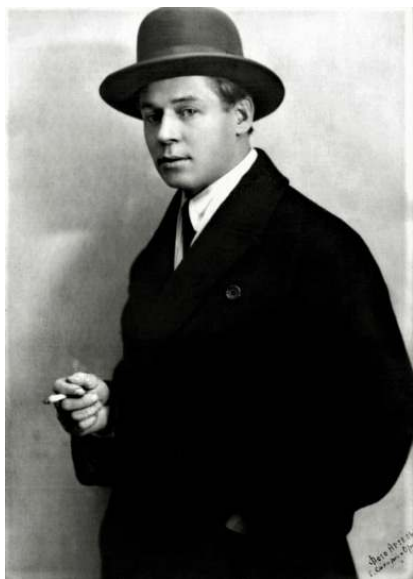
Последнее прижизненное фото С.А. Есенина. Октябрь 1925 г.

С.А. Есенина. Изданных же с середины 1950-х годов прошлого века и до наших дней сборников с избранными стихами поэта и вовсе не счесть.