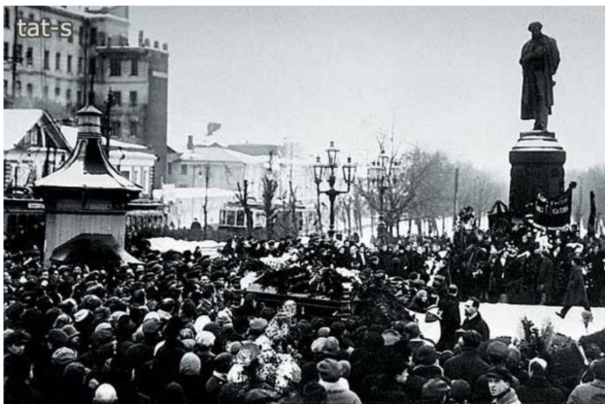
Траурное шествие у памятника А.С. Пушкину. Гроб поэта обнесли вокруг монумента 3 раза.