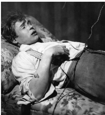
Тело Есенина, извлечённое из петли.