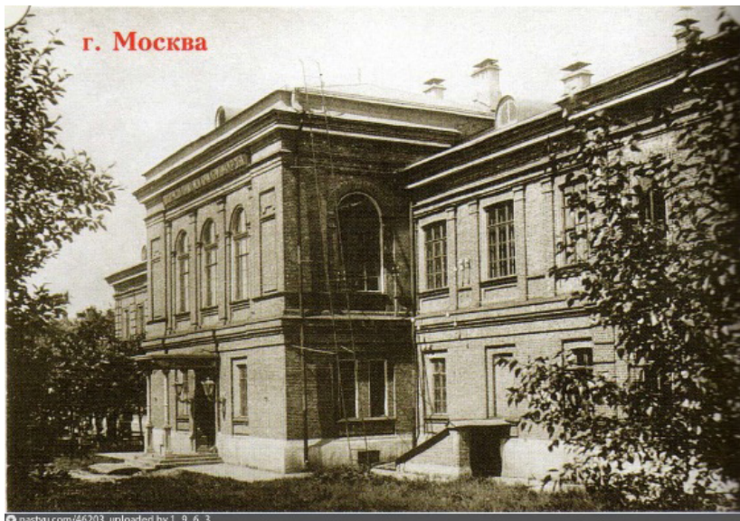
Клиника нервных болезней 1-го Московского университета, где с 26 ноября по 21 декабря 1925 года лечился С.А. Есенин

Приверженцы версии убийства поэта, как до них, впрочем, и представители официального литературоведения, начиная с 1950–1960-х годов, за редким исключением полностью проигнорировали медицинскую сто-