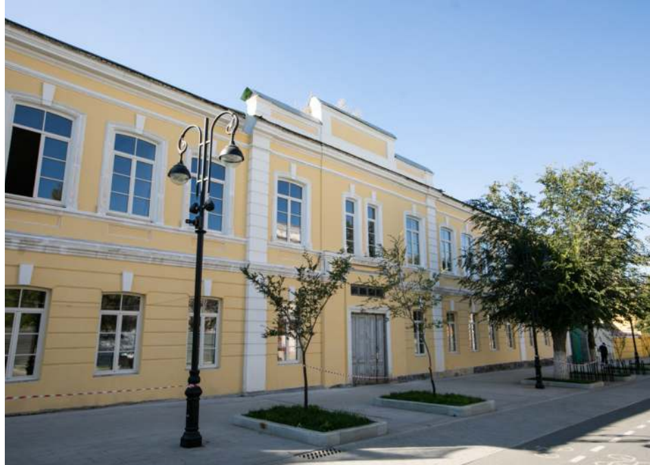
Новый музей в исторических стенах