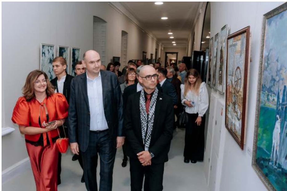
Губернатор Оренбургской области Евгений Солтцев с почётными гостями