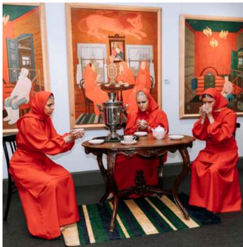
Арт-реконструкция картины Юрия Рысухина «Памяти В. Попкова»