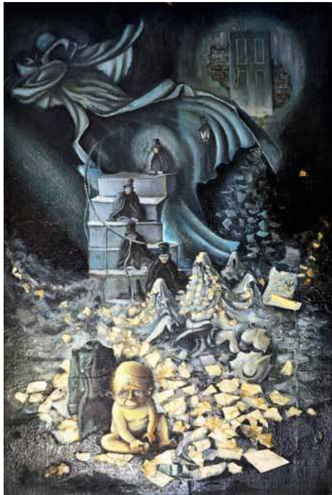
Эскиз Александра Толмачёва к спектаклю «Шинель» Н.В. Гоголя