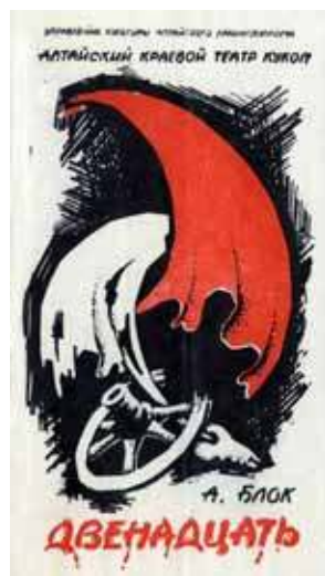
Театральные программки. Художник — Александр Толмачёв

Гоголевский мистицизм был близок Саше. В его характере было что-то мистическое, оправданное его многогранным талантом. Саша был глубоким пессимистом, хотя жаждал успеха. В этом мы с ним уравновешивали друг друга — я жизнерадостный человек. Мне повезло с Сашей, а ему со мной. Вот пример, доказывающий мое убеждение. Мне понравился первый Сашин эскиз к «Шинели», он меня впечатлил, я ничего не сказал и ушел думать, придумывать спектакль. Прихожу к нему в кабинет через какое-то время и вижу: понравившийся мне эскиз разорван на четыре части и брошен в корзину для мусора. Я зорал