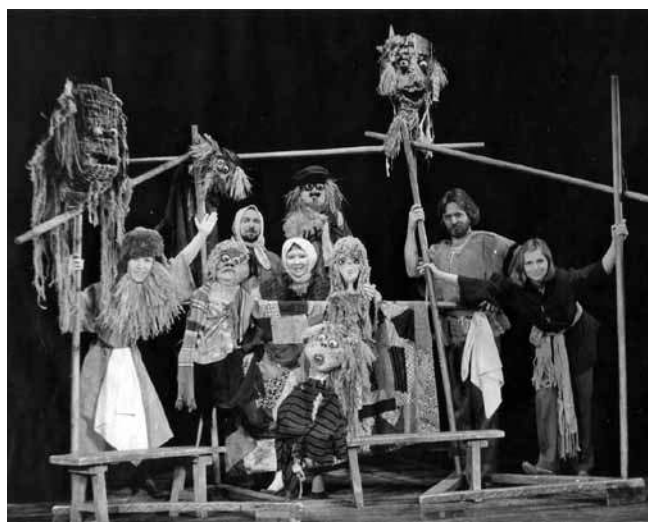
Сцена из спектакля «Двенадцать месяцев»