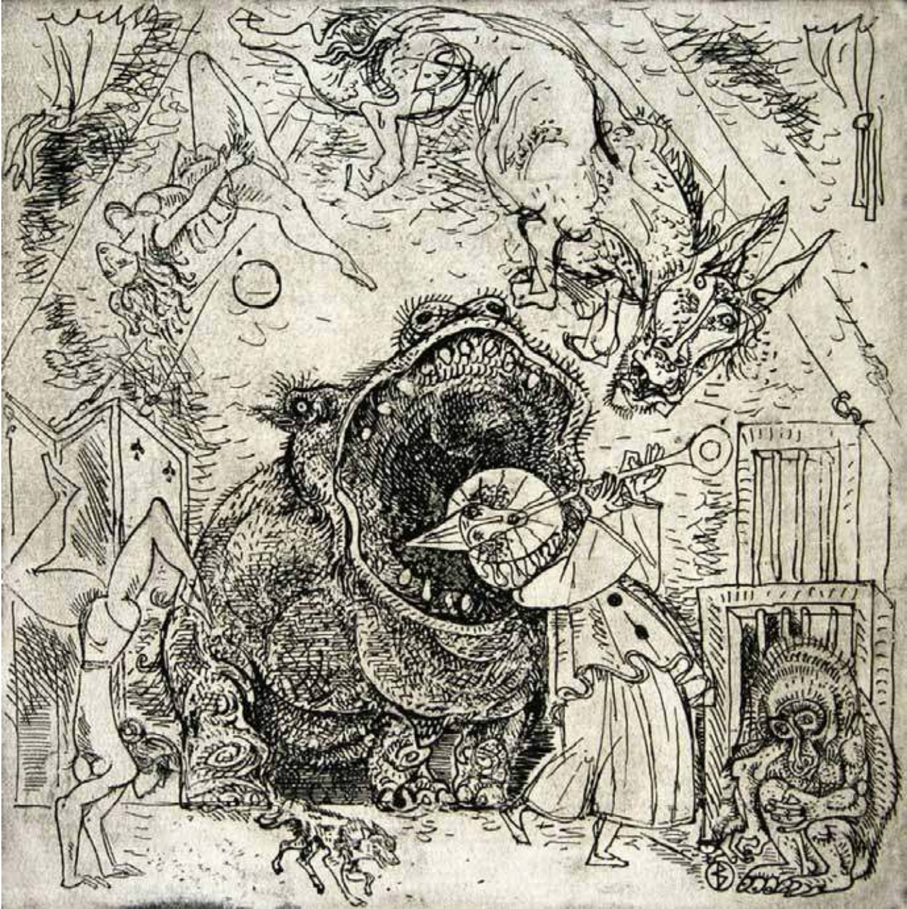
Виталий Волович. Клоун и гиппопотам. Из серии «Цирк». 1980. Бумага, офорт. 59,8x46,8