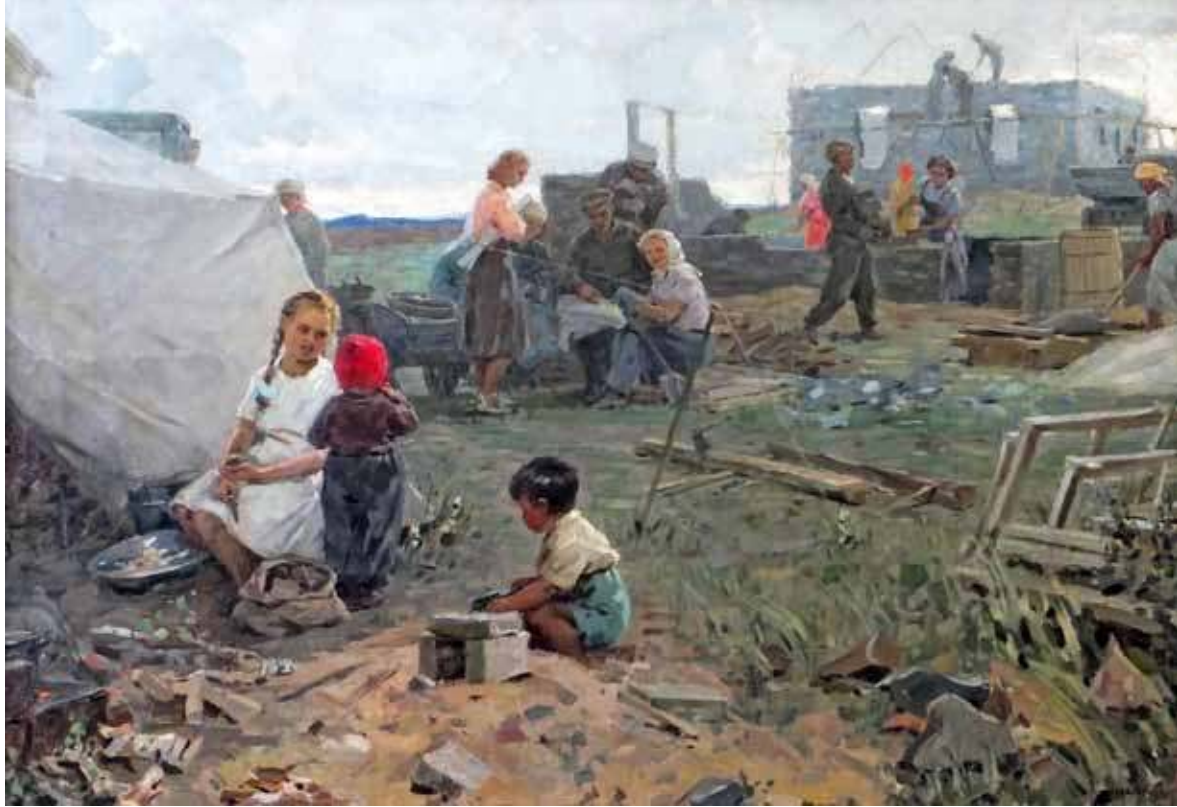
Ираида Соколова. Новоселы . 1956. Холст, масло. 127х180. Собственность ГХМАК

Рядом с целинниками всегда были художники, работающие с натуры. Они создавали художественную летопись тех дней.