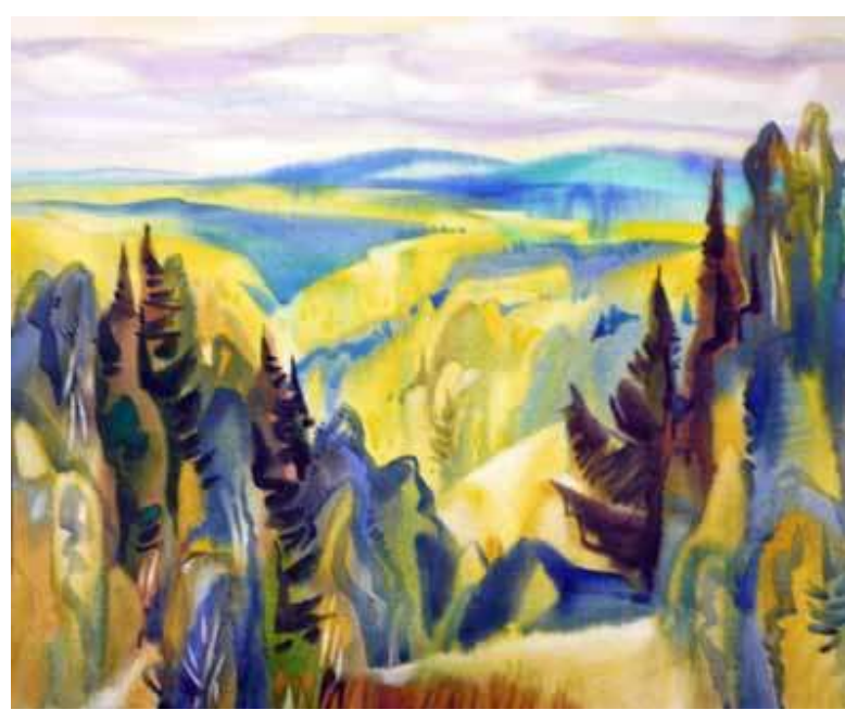
Вячеслав Абрамов. Светлые дали . 2017. Бумага, акварель. 50,7х63

Наряду с частными коллекционерами в выставке приняли участие музеи и галереи. Государственный художественный музей Алтайского края выставил работы Виталия Михайловича Воловича (Екатеринбург), художника, ушедшего в 2018 году. Его интеллектуальная графика рождает необычные и неожиданные ассоциации, противоречивые эмоции — от отторжения до благоговения. Это произведения подлинного мастера.