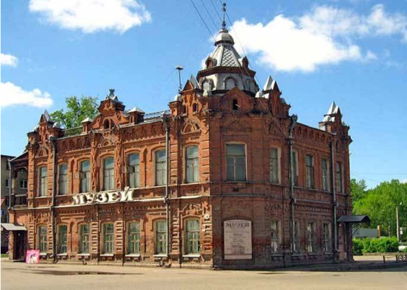
Краеведческий музей им. В.В. Бианки в Бийске

журнале «Воробей». Потом эти календарные страницы превратились в знаменитую «Лесную газету на каждый год».