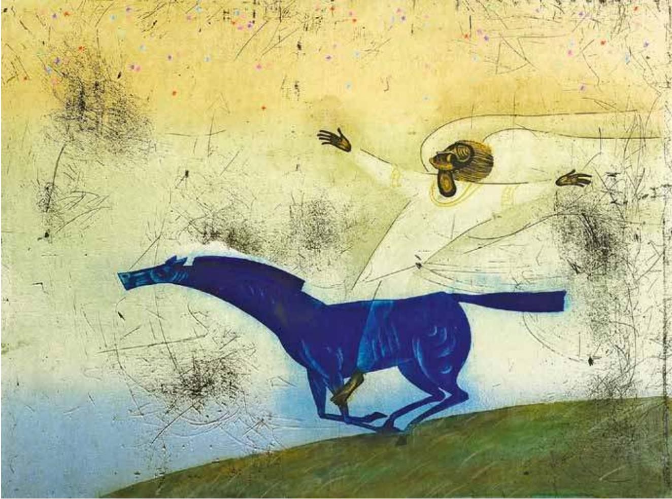
Андрей Машанов. Вдохновение . 2001. Бумага, офорт, акварель, золото