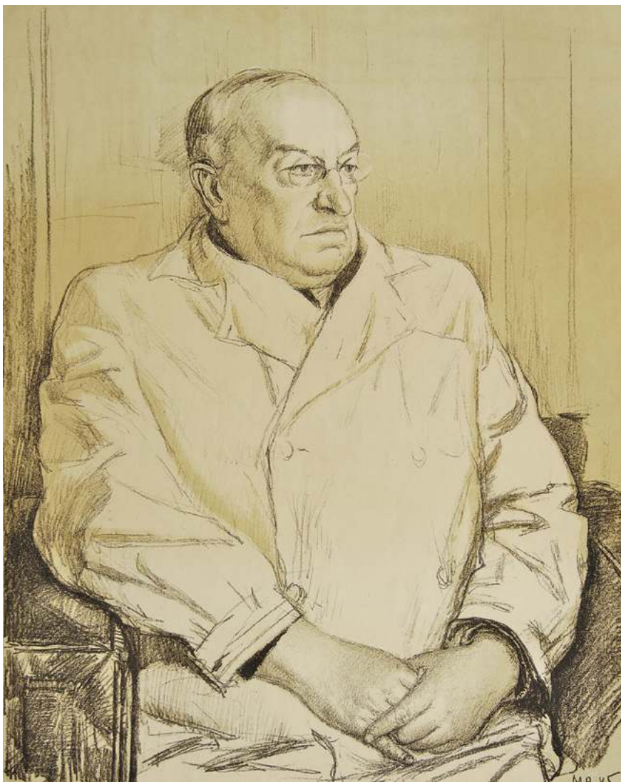
Михаил Родионов. Портрет Героя Социалистического Труда академика А.И. Абрикосова.

1945. Бумага, литография. Л: 84х57,8. И: 54,6х43,9