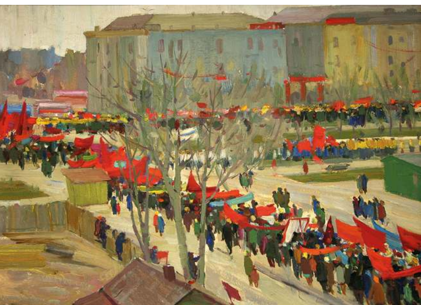
Фёдор Торхов. Первомайская демонстрация в г. Барнауле. 1964. Картон, масло. 51,7x71,4

В октябре в Государственном художественном музее Алтайского края демонстрировалась персональная выставка заслуженного художника России Фёдора Торхова, посвященная 90-летию мастера.