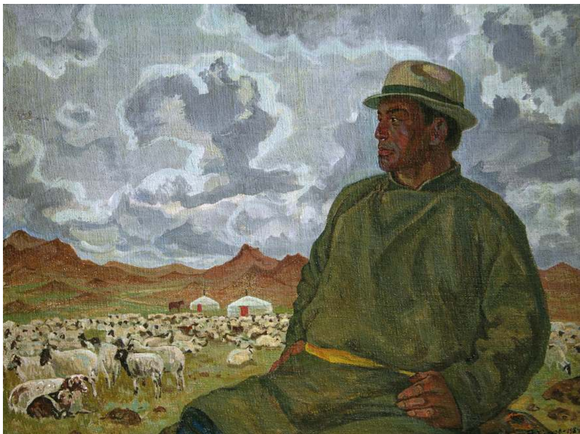
Фёдор Торхов. Бригадир Б. Дамбадаржи из Мандах сомона. 1984. Холст, темпера. 91х122

Специально к выставке был подготовлен и издан каталог произведений Ф.С. Торхова, находящихся в музейном собрании. Подарочное