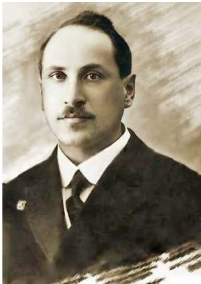
Н.Ф. Шубкин «Повседневная жизнь старой русской гимназии»

Волновали педагога проблемы и других сторон жизни. Начавшаяся в 1914 году Первая мировая война принесла много горя. Воевать уходили здоровые, сильные, а среди тех, кто возвращался с фронтов, было немало