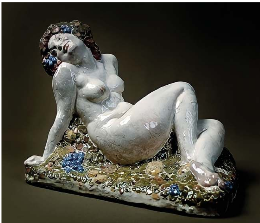
Николай Андреев. Вакханка . 1911–1912. Из коллекции ГТГ

В парижский период Георгий Лавров ярко проявил себя как