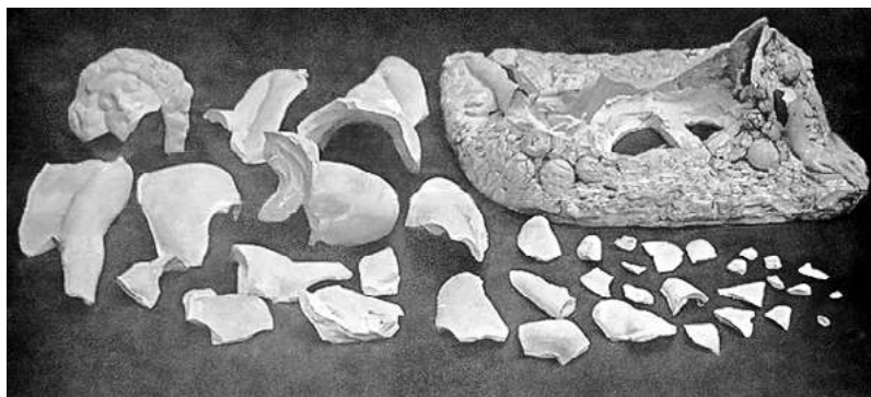
Николай Андреев. Вакханка . 1911–1912. Фрагменты скульптуры до реставрации.

Прекрасный образец русского модерна в скульптуре — андреевская «Вакханка» — радует посетителей художественного музея Алтайского края по сей день. ■