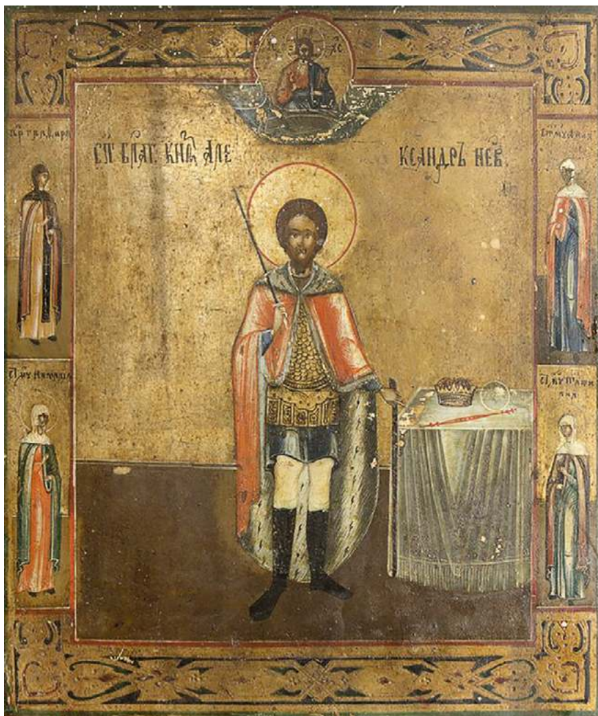
Неизвестный иконописец. Александр Невский . Конец XIX века. Дерево, темпера. 30,8x26,4x2,2. Собственность ГХМАК

иконе «Богоматерь всех скорбящих радость», датируемой первой половиной — серединой XIX века (Невьянск). Не признававшие официальную власть хранители древлеправославия, видимо, видели в Александре Невском не только смирение инока, но и доблестного воина, пребывающего в молитве за русскую землю.