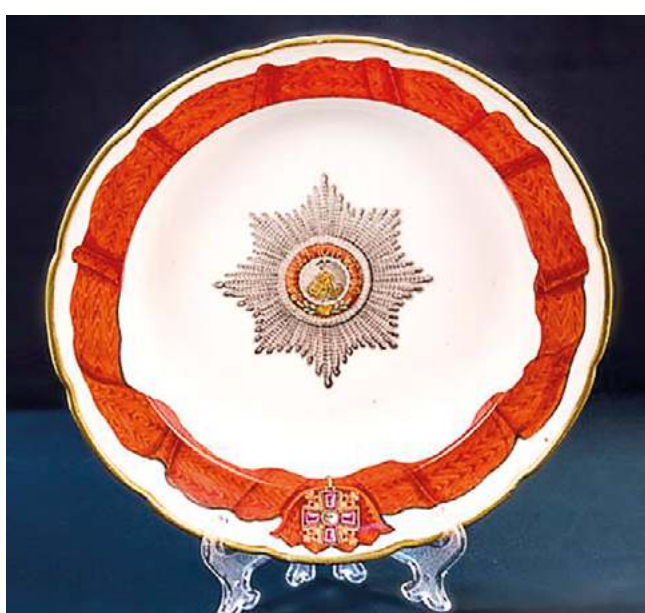
Тарелка глубокая. Из серии «Орден Александра Невского». 1778. Фарфор, роспись, позолота. Д-22. Собственность ГХМАК

Тем более в период русско-шведской войны историческое сопоставление прошлых и современных событий было очевидным. Пётр лично перевез мощи святого князя из Владимира в Петербург, где на левом берегу реки Невы был основан Свято-Троицкий Александро-Невский монастырь в память Невской битвы. В этом же 1724 году Святейший Синод постановил писать святого Александра Невского в воинских доспехах и царской мантии, подбитой горностаем, а к его титулу добавить слово «великий». Такой извод образа святого акцентировал внимание на военных подвигах князя и его заслугах перед Отечеством.