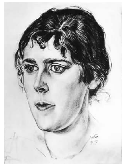
Владимир Гринберг. Женский портрет. 1917