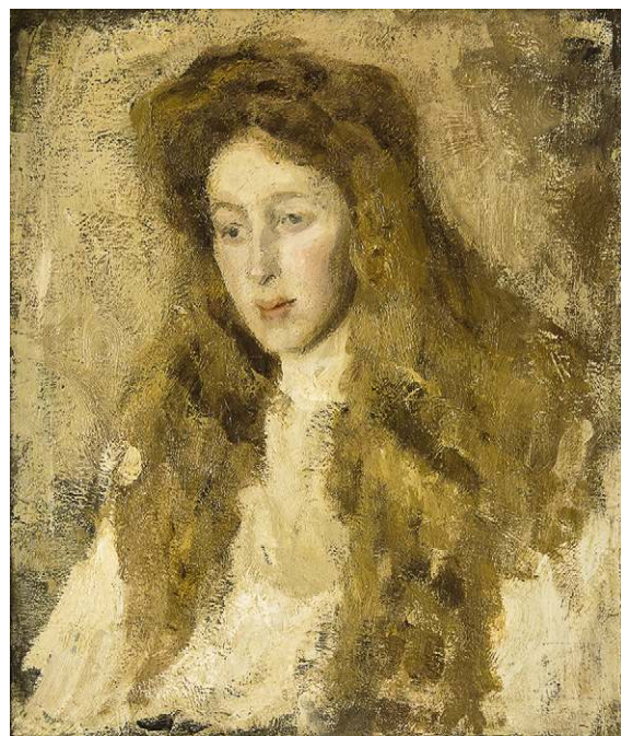
Николай Ульянов. Портрет девушки. 1900-1903. Холст, масло. 61,5x51

Так, Василий Поленов стремление к свету выводит из чисто художественной проблемы в духовно-нравственную потребность, совершив эстетическую революцию в русской живописи. В 1890 годах художник приобретает участок земли в красивейшем месте на высоком берегу Оки, строит там по собственному проекту усадьбу «Борок». Приокская природа вдохновляет художника