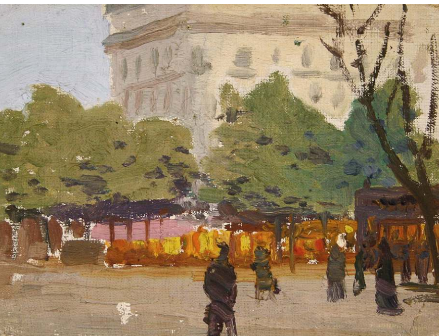
Андрей Никулин. Сумерки . Париж. 1904. Холст, масло. 16,5х20,8