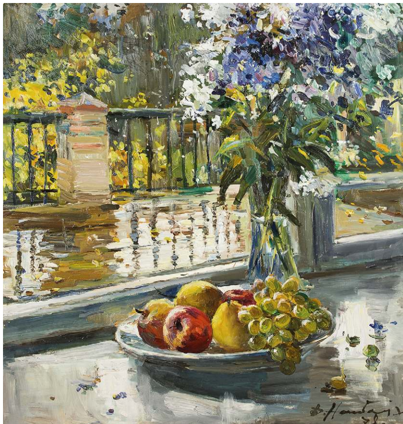
Дмитрий Налбандян. После дождя. 1979. Картон, масло. 78,5x73,1

на создание целого ряда великолепных произведений, в их числе и «Вечер на Оке», и «Пейзаж с речкой», которые хранятся в собрании ГХМАК. Эти работы сочетают в себе лирическое и эпическое начала. Широко, в яркой красочной гамме написан «Пейзаж с речкой». Приселочная дорога уводит взгляд зрителя через луга