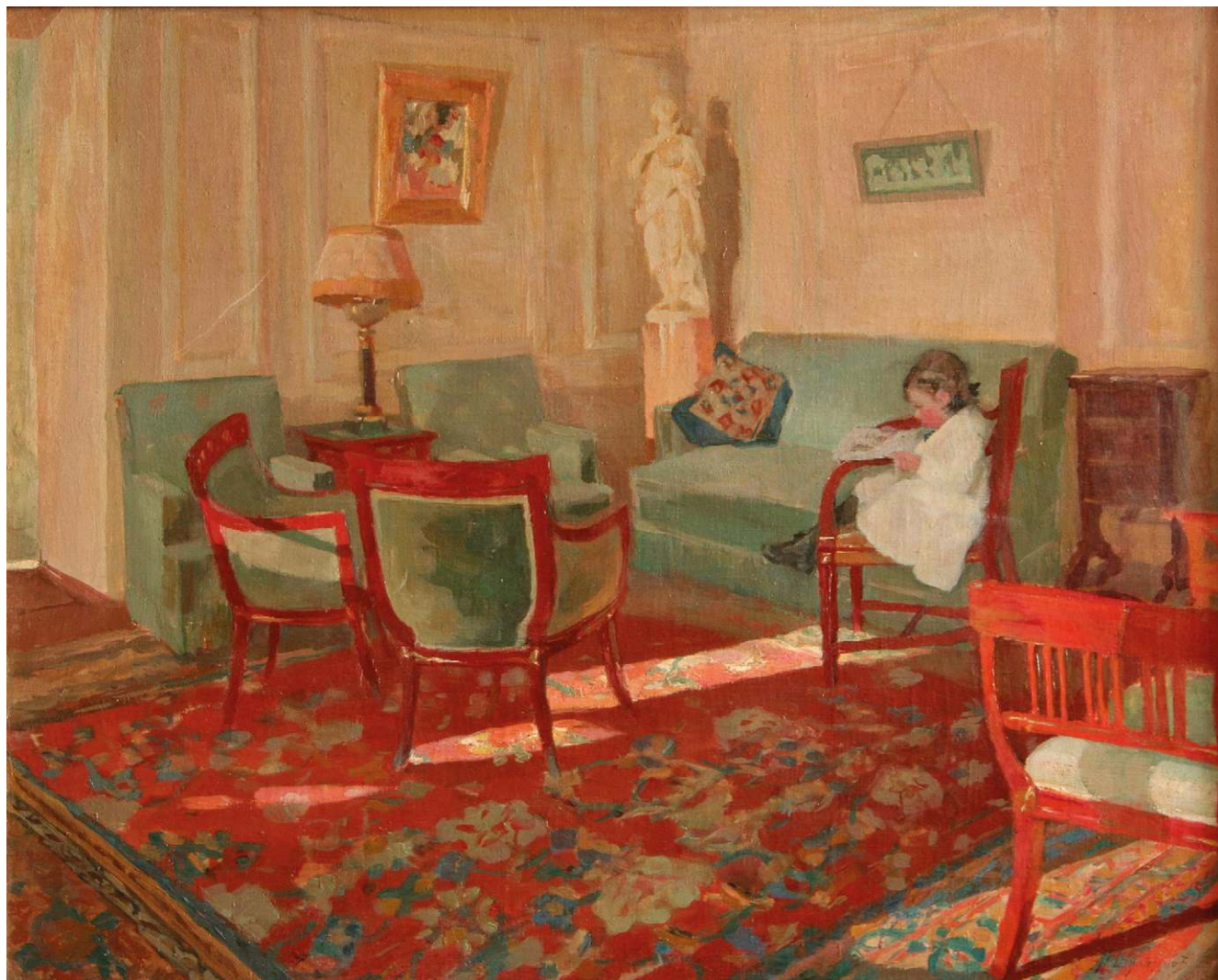
Николай Шуппинов. Интерьер . 1910-е—1920-е. Холст, масло. 56,5х69,5

и холмы в бесконечную даль. Вытянутый в длину формат полотна, высокая точка обзора позволяют художнику импрессионистически передавать родные просторы, полные воздуха и солнечного света.