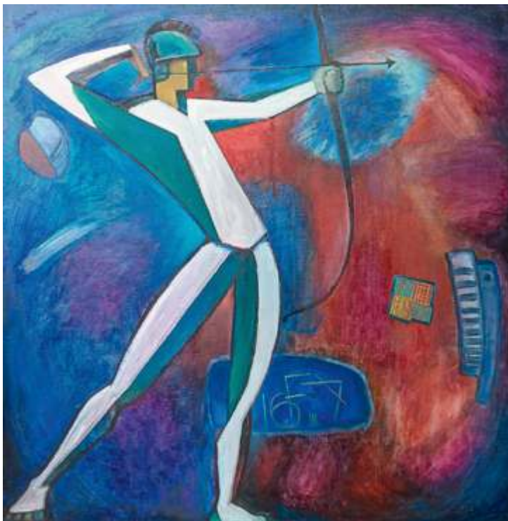
Альфред Фризен. Лучник. 2015. Холст, масло. 122x120