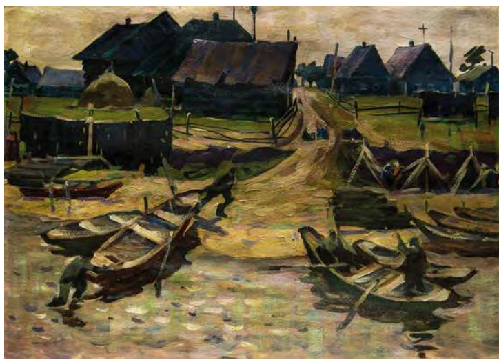
Алексей Малышев. Рыбачий поселок. Из серии «Новосибирск — Сургут». 1975. Бумага, акварель, темпера. 64x89