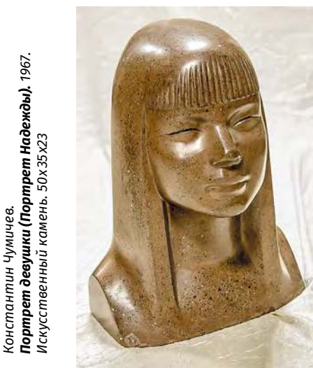
Константин Чумичев. Портрет девушки (Портрет Надежды). 1967. Искусственный камень. 50x35x23