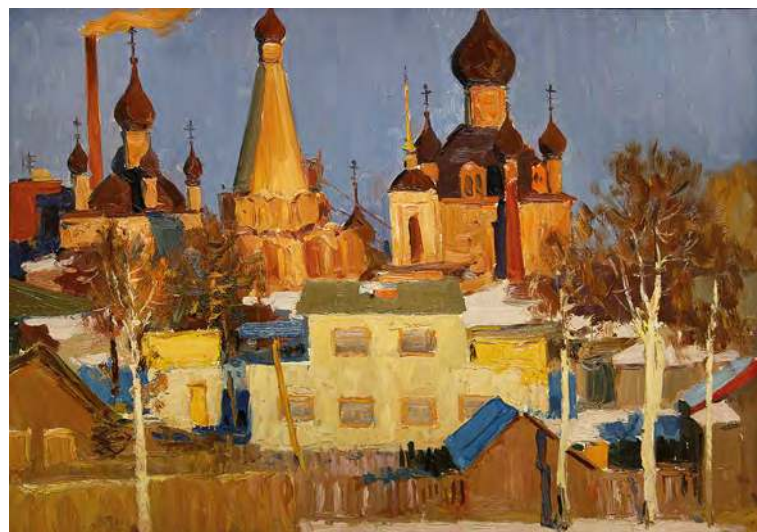
Семён Чернов. Городские контрасты. Из цикла «По Золотому кольцу». Картон, масло. 49,5x70