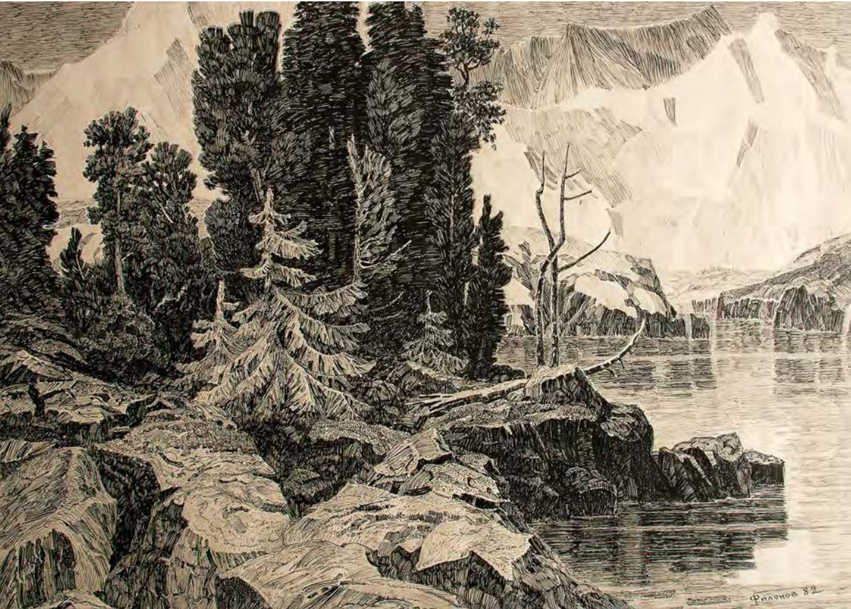
Фёдор Филонов. У белков. Тушь, бумага, перо. 77х98

В Государственном художественном музее открылась выставка, посвященная Дню Победы. В виртуальной экспозиции на сайте музея ( http://ghmak.ru/expo/index.php ) представлены сорок четыре произведения живописи, графики и скульптуры двадцати трех авторов