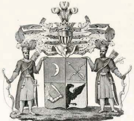
Гербъ рода Мамаевыхъ