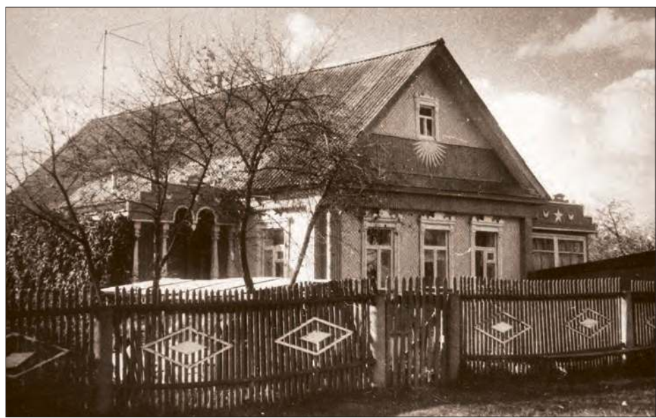
Село Нижнее Хорошово. Дом № 13 по улице Луговой.

творчества нужны тишина и покой, и ребята с пониманием относились к просьбе бабушки Ани. Метров за пятьдесят до дома выключали мотор и тихо катили мотоцикл по дороге.