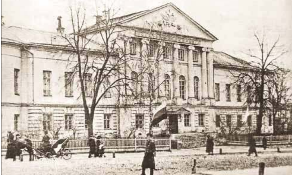
Здание Рязанской губернской мужской гимназии (фото конца XIX – начала XX вв.)

не только повторяет, но и детализирует свою просьбу: «Сим ещё прошу вас не оставить их в случае надобности, снабдив их всем, что будет им нужно, на счёт Московской губернской гимназии. Квартира может им отведена быть в новом гимназическом доме. На стол, по мнению моему, достаточно положить на каждого пять рублей в месяц, которые прошу вас выдавать г. Назарьеву ежемесячно с распискою. ... Впрочем, я всего ожидаю от вашего благоразумия и надеюсь, что если бы по обстоятельствам принуждены были следовать и далее, вы не оставите подать им руку помощи». Просьбу Дружинина поддержал, со своей стороны, и попечитель учебного округа.