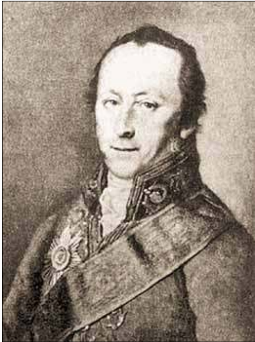
Павел Иванович Голенищев-Кутузов – попечитель Московского учебного округа (1810–1816)

этого лишь 15 подвод. Поэтому было решено отправить гимназическую казну, библиотеку и самые необходимые вещи, и 29 августа обоз с запечатанными гимназической печатью ящиками под охраной нескольких солдат выехал вместе с университетской казной в Нижний Новгород.