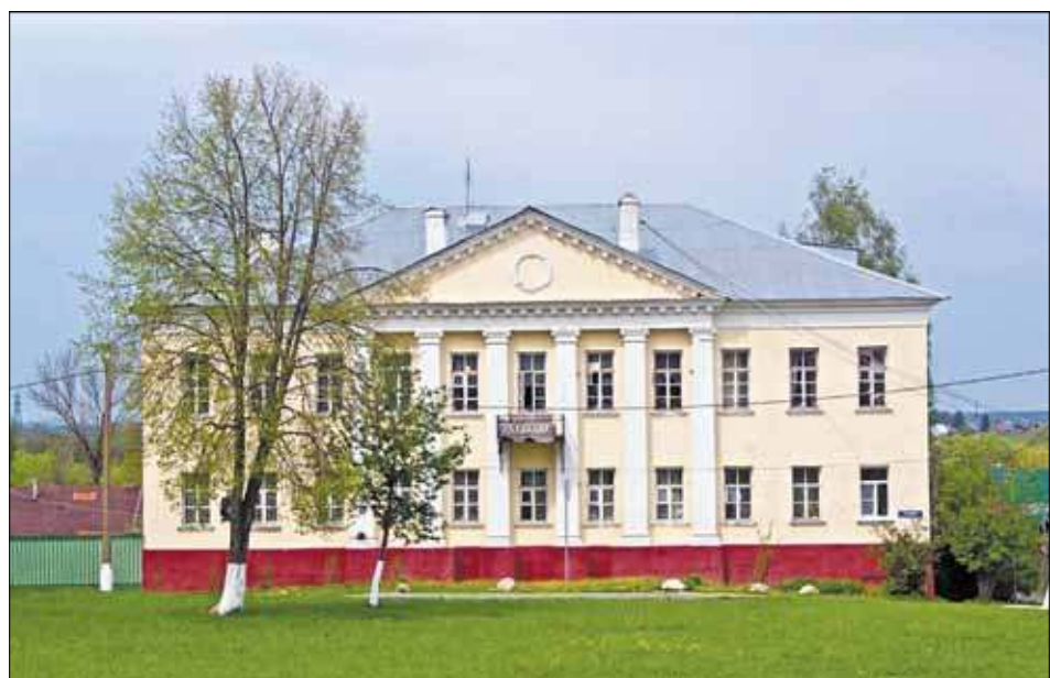
Здание Коломенского уездного училища (современный вид)

В таком виде занятия продолжались до конца 1813 года. А это означало, что гимназический пансион функционировал в Коломенском уездном училище как полноценное учебное подразделение: зимой и весной по расписанию шли уроки, с конца июня наступили летние каникулы, и учащиеся разъехались по родительским домам, а в августе они вернулись в Коломну и возобновили учёбу.