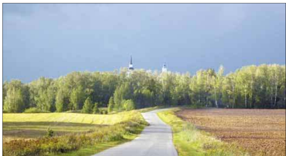
Храм Троицы Живоначальной в Голочёлове (1752 г.).