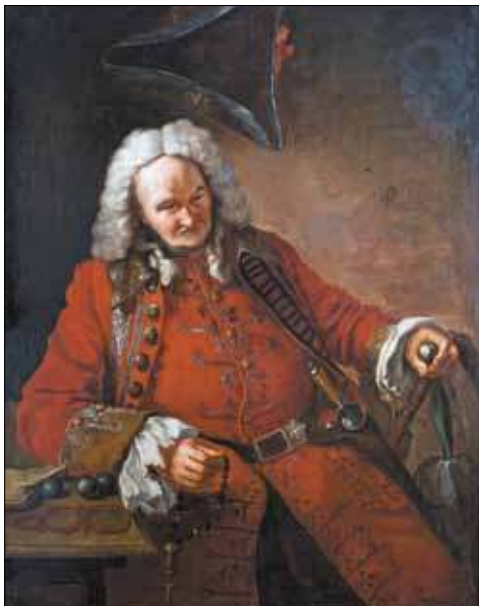
Портрет шута Балакирева (1699 – 1763). Неизвестный автор. Из экспонатов Путевого дворца в Стрельне.

ходила в отдельном от церкви здании. Попечителями школы в конце 1880-х — начале 1890-х годов были временные московские купцы Иван Филиппович Савостьянов и Сергей Фёдорович Мосолов 15 .