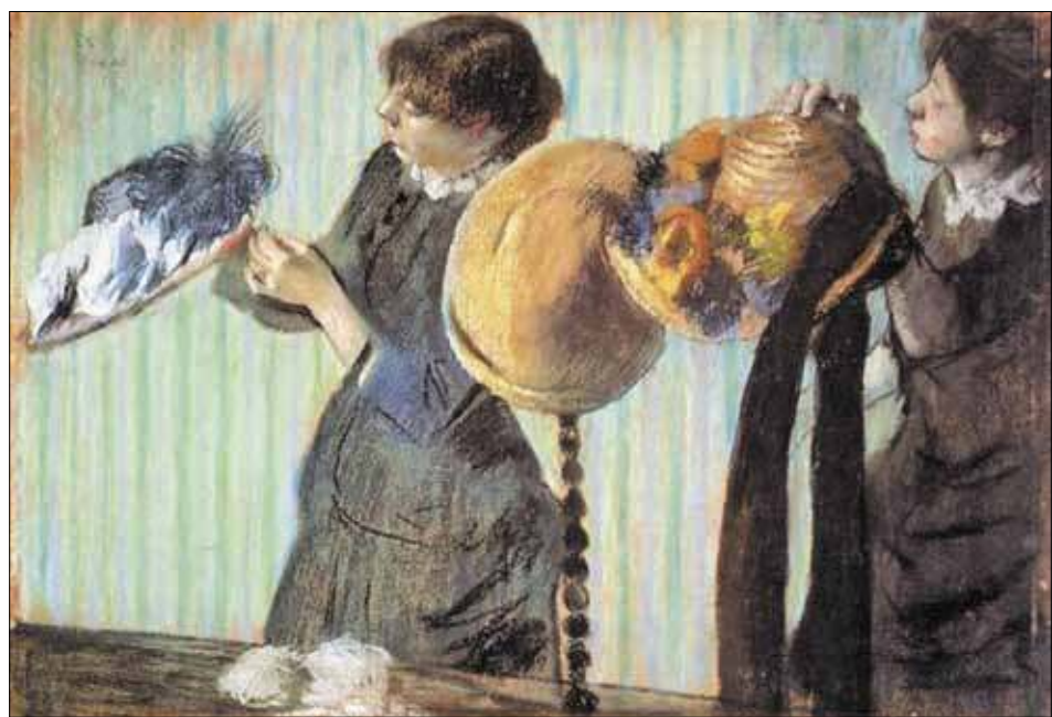
«Модистки», Эдгар Дега, 1882 г.