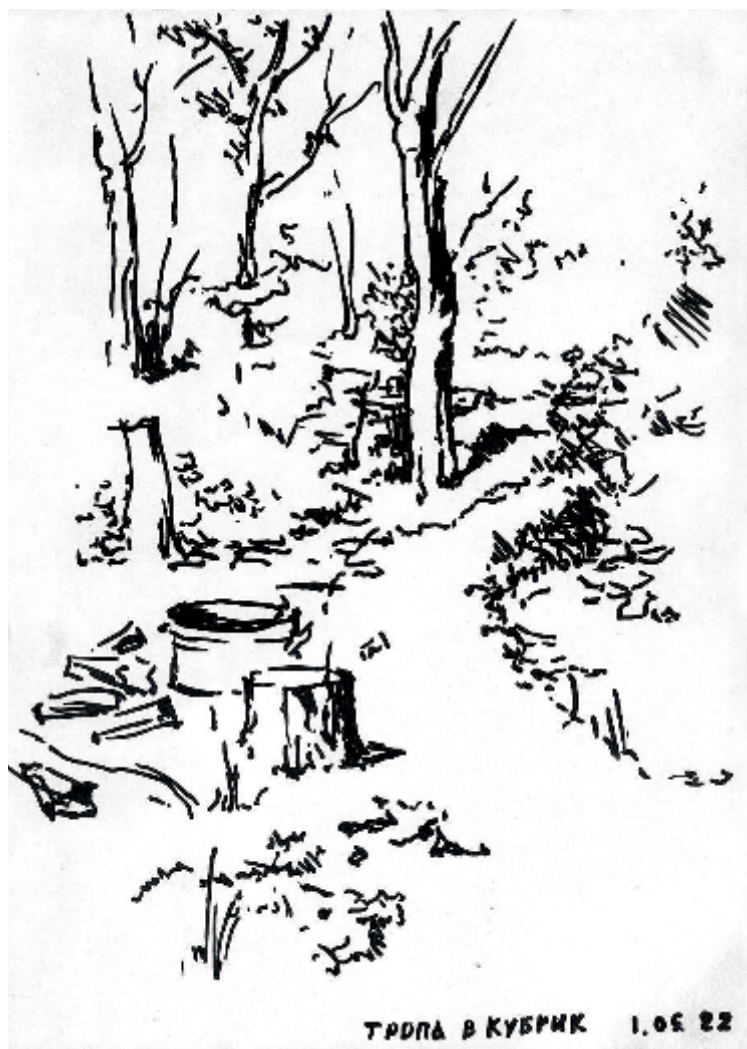
ТРОПА В КУБРИК 1.05 22