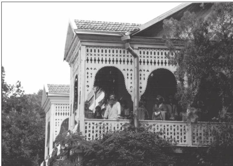
Театрализованная историческая реконструкция «В. Г. Короленко в Джанхоте», июль 2003 г.