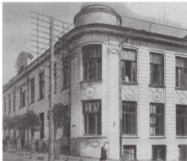
Здание витебского художественного техникума (довоенное фото)