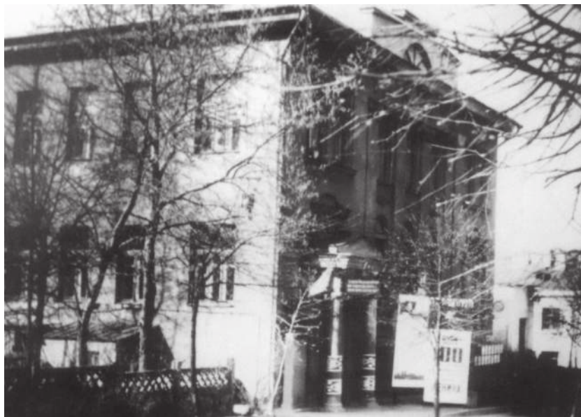
Здание витебского народного художественного училища. 1930-е гг.

В продолжение театрального успеха поставлен супрематический балет. Постепенно формировалось и объединение, обзаводясь отличительными чертами: логотипом УНОВИСа стал «Чёрный квадрат» Малевича — уновисовцы нашивали его на лацкан пиджака или рукав рубахи. Девизом выбрали цитату художника: «Ниспровержение старого мира искусств — да будет вычерчено на ваших ладонях». Малевич разработал собственную систему обучения, направленную на детальный разбор особенностей искусства, получившего название супрематизм. Жизнь училища подчинили идее разработки «нового искусства». Педагогическая система Малевича основыва-