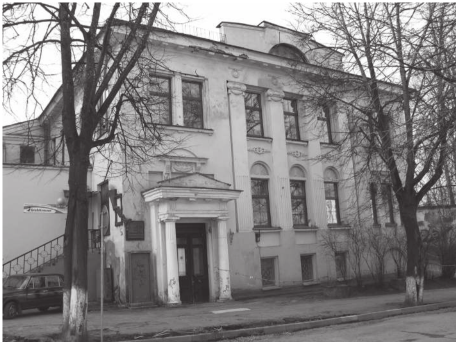
Здание витебского народного художественного училища (до реставрации и открытия музея)

лась на представлении о поэтапном развитии искусства от кубизма к супрематизму. Обучение начиналось с сезаннизма как начальной стадии беспредметного искусства, затем студенты учились работать в манерах кубизма и кубофутуризма, постепенно продвигаясь к освоению супрематической беспредметности. При этом старшие члены УНОВИСа одновременно были в положении учеников и преподавателей, со студентами постигая принципы «нового искусства». В 1921 году в ответ на недовольство противников супрема-