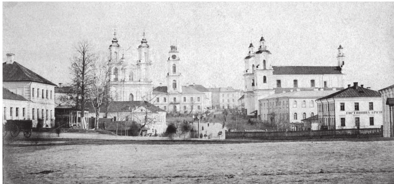
Витебск. Конец XIX века