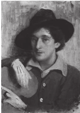
Ю. Пэн. Портрет Шагала. 1914 г.