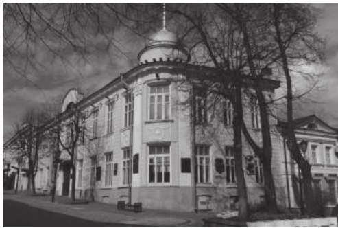
Здание витебского художественного техникума (сегодня)