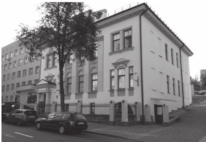
Здание витебского народного художественного училища (музей)