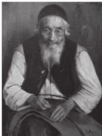
Ю. Пэн. Старый портной. 1910 г.