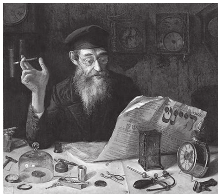
Ю. Пэн. Портрет Часовщик. 1914 г.

Школа живописи Ю. М. Пэна существовала до 1919 года, пережив революционные события, охватившие Россию в 1917 году. Однако в новом времени и при новых порядках художнику сложно стало вести привычный образ жизни. Да и увлечение реалистической школой живописи, приверженцем которой Пэн оставался до конца дней, не сочеталось с веяниями революционного времени. Вместе с революцией социальной, начиная с 1918 года, Витебск переживает «культурную революцию». Гонимые из столиц революционным голодом и необходимостью заработка, в Витебск приезжают известнейшие деятели культуры разрушившейся империи: К. К. Григорович, Н. А. Малько, Р. А. Унгерн,