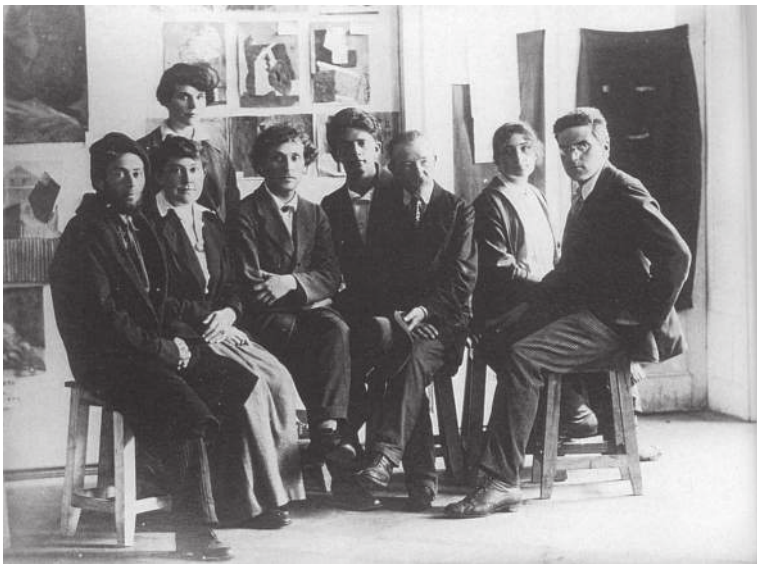
Май 1919 г. Шагал с преподавателями училища

до художественного техникума, ректором которого назначили скульптора-реалиста М. А. Керзина. Вскоре техникум покинул стены особняка на улице Бухаринской.