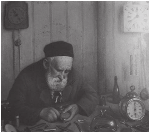
Ю. Пэн. Портрет Часовщик. 1924 г.

минаниям современников, губернатор Витебска Левашов во всём благоволил художнику, видя в его стремлении создать школу живописи перспективы для развития культуры города. Впоследствии адрес школы менялся: улица Смоленская в доме Глезермана, Большая Могилёвская, в скором времени переименованная в Гоголевскую, куда школа переехала в дом Слуцкого, там же, согласно архивным сведениям, располагалась и мастерская художника.