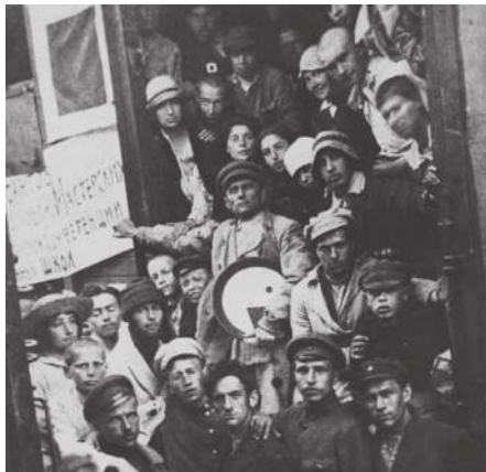
6 июня 1920 г. Малевич с учениками едет в Москву. Вокзал

никам, оформляли уновисовцы. С этой фотографией связана ещё одна витебская городская легенда. Считается, что тем же поездом, только в другом вагоне, из Витебска навсегда уезжал Марк Шагал.