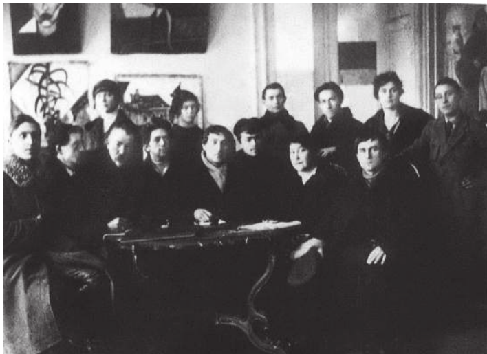
1920 г. Шагала вместе с учениками и преподавателями

ние Малевича в училище навсегда изменит его историю, поделив его на «период Шагала» и «период Малевича». Впрочем, мы вправе утверждать: приезд Малевича навсегда изменит историю не только училища, но и всего мирового искусства, определив в нём особую роль Витебска. Исходя из датировки писем, которые К. Малевич отправляет из Витебска, можно утверждать: его приезд в город состоялся не позднее 7 ноября 1919 года. Витебский период Казимира Малевича можно охарактеризовать как плодотворный и интересный, в первую очередь, для художника. В городе на Двине он нашёл то, чего был лишён в двух столицах — благодарных учеников и коллег-единомышленников. Сразу после приезда Малевич развивает бурную просветительскую работу.