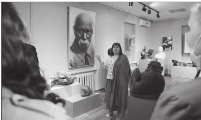
На фестивале «Диалоги со временем», октябрь 2021 г.