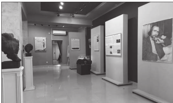
Выставка Эрзи в музее Геленджика

рез столетие». В 2021 г. администрацией города, геленджикским музеем при участии Международного фонда искусств имени С. Д. Эрзи (Москва), Мордовского Республиканского музея изобразительных искусств им. С. Д. Эрзи (Саранск) проведён масштабный двухмесячный фестиваль искусств «Диалоги со временем», посвящённый жизни и творчеству Сте-