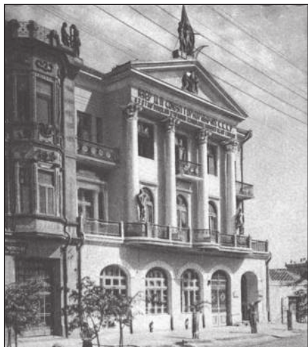
Дом Союза горных рабочих в Баку

сийск, затем в Батуми. В 1924 г. С. Эрзя принимает заказ на украшение скульптурами фасада Дома Союзов горняков Азербайджана в Баку.