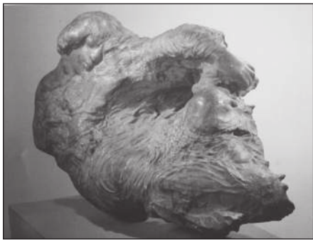
С. Эрзя. Летящий. Кавказский дуб, 1922