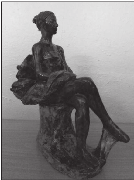
Мроз Е. Балерина, 1966

вернулась в Москву, где на протяжении многих лет жила и работала. Постоянно участвовала в выставках. Создала произведения: «Балерина», «Хореографический этюд», «Отдых», «Девушка с лотосом», «Скрипачка», «Партизанка», «Мир Вьетнаму», «Светлана», «Мордовка» и другие. В её работах чувствуется влияние Эрзи: они обладают той же пластикой, мягкостью и гибкостью линий, яркой образностью, прекрасным использованием фактуры материала, мастерством передачи душевных движений. В них видно то же умение тонко передавать различные типы женской красоты.