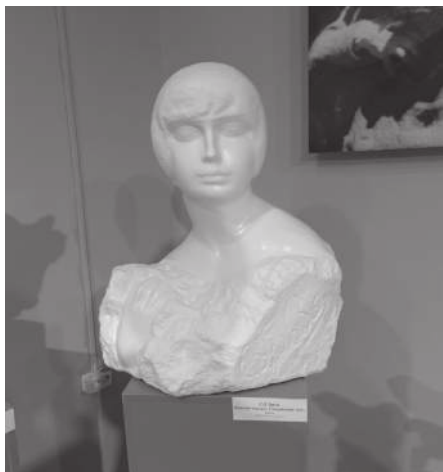
С. Эрзя. Спокойствие. Мрамор, 1919