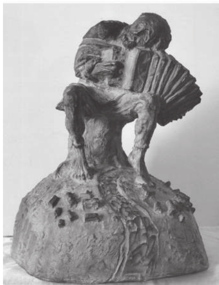
«Бывший первый парень на деревне».

домовой церковке с иконостасом, с иконами местного письма. И он, мальчишкой, замирал, как когда-то Иван Бунин перед Михаилом Архангелом, перед святыми угодниками, ангелами с крыльями и пугался чертей, варящих в адских котлах грешников. Приходили туда тайком православные молиться по церковным праздникам. Никто не выдал. Да в Пучуге в открытую в советское время праздновали и Пасху, и Рождество, и Троицу, и Петров день, накрывали столы, танцы устраивали. Словом, жили общинно и сохраняли обычаи и привычки незапамятных времён. Дети без понимания азартно «гуляли» вместе со всеми. Не изживаемы традиции отцов и дедов, и