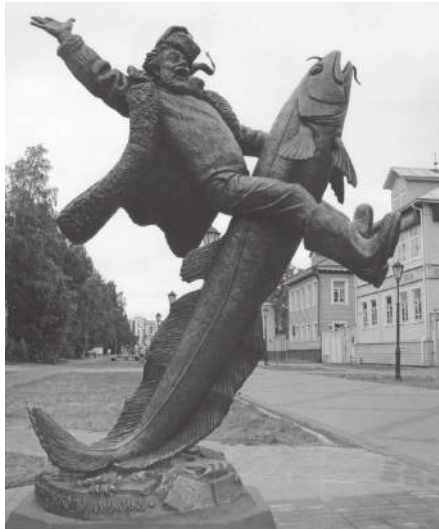
Скульптурная композиция по сказкам С. Писахова «Архангельский мужик».

Для нового сборника 2016 г. писаховские сказки он отбирал, стараясь избегать резких нападок на «попов» и градоначальников. (Дело-то