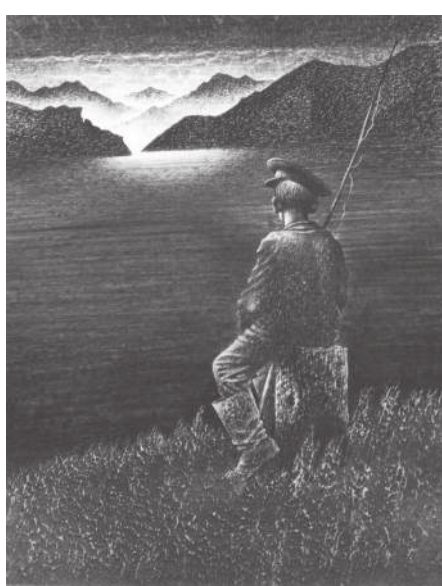
В. Астафьев. «Монах в новых штанах».

Иллюстрации к астафьевским рассказам помечены 1990 г. А в конце 80-х Сергей едет в Москву, в издательство «Детская литература». Главный художник Борис Аркадьевич Диодоров, знаменитый иллюстрациями к сказкам С. Лагерлеф и А. Милна, без преувеличения, приходит в полный восторг от предъявленной ему папки с книжной графикой. Наконец-то перед ним художник, который справится со сборником сказов о народных умель-