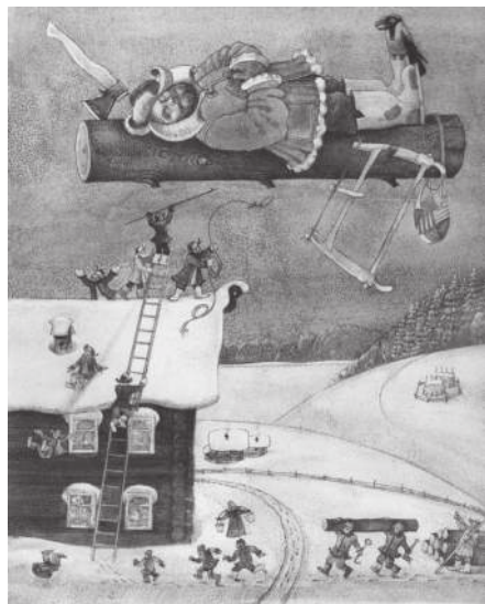
С. Писахов. «Сказки».

Изобретательный Сюхин много всего не без юмора напридумывал