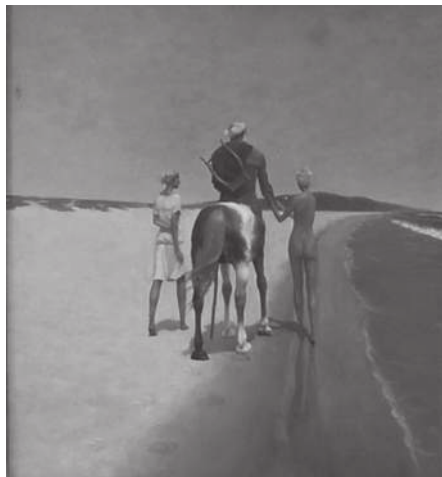
Хирон со спартанками