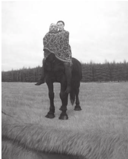
У реки весной