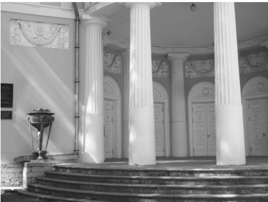
Елагин остров. Павильон под флагом