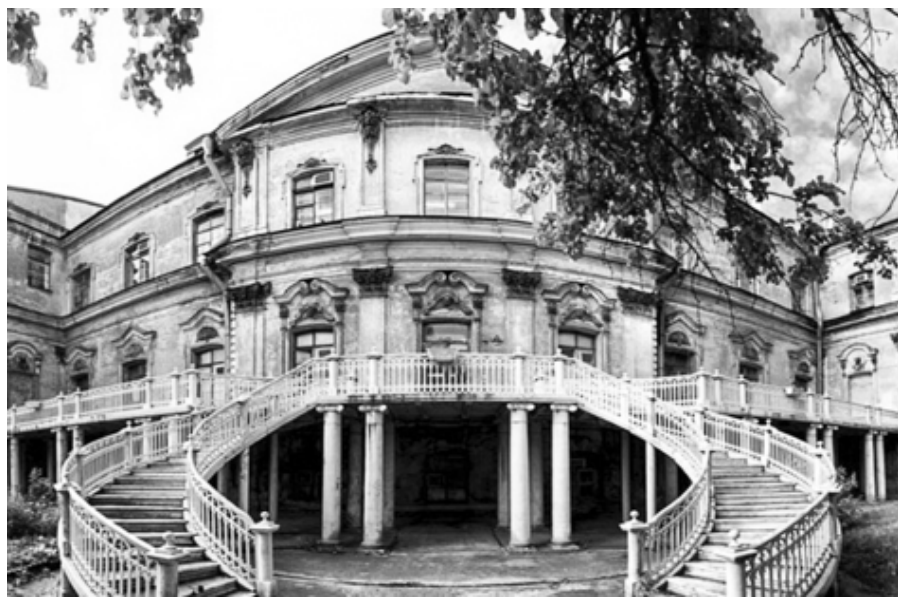
Усадьба Демидовых в Санкт-Петербурге

Родился Акинфий Никитич Демидов в Туле, скончался в 1745 году на берегу Камы, близ села Яицкого Устья. В первом браке у Акинфия Никитича родились сыновья Прокофий и Григорий, но почти все свое состояние А.Н. Демидов завещал своему сыну от второго брака Никите. Такое завещание он составил под влиянием своей второй супруги. Вспомнил, что и Екатерина I добивалась того же от своего супруга. Их дочь Елизавета Петровна, ставшая императрицей, помнила о трагедии своего старшего единокровного брата царевича Алексея и завещание почившего Акинфия Никитича не утвердила. Она велела разделить его наследство поровну между тремя братьями,