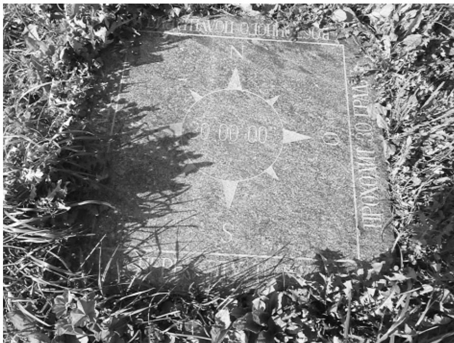
Сиворицы. Пулковский меридиан

Посещали Сиворицы государственный деятель П.В. Завадский, мемуарист Палладий Лавров, путешественник Г. фон Реймерс. Жанр мемуаров был популярен и любим в XVIII веке.