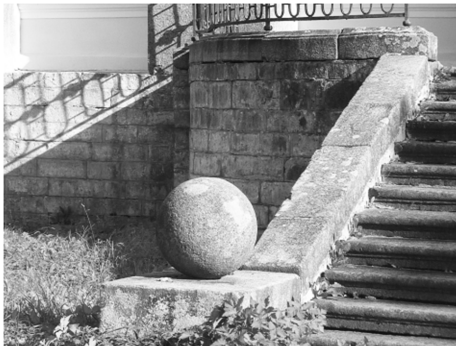
Сиворицы. Лестница в парк, гранитный шар

В Сиворицах бывали известные люди своего времени: графы Григорий и Алексей Орловы со своими свитами. Говорят, что между графом Алексеем Григорьевичем Орловым, героем Чесмы, и хозяйкой дома, Е.П. Демидовой (1748–1810), урожденной Жеребцовой, была многолетняя любовная связь.