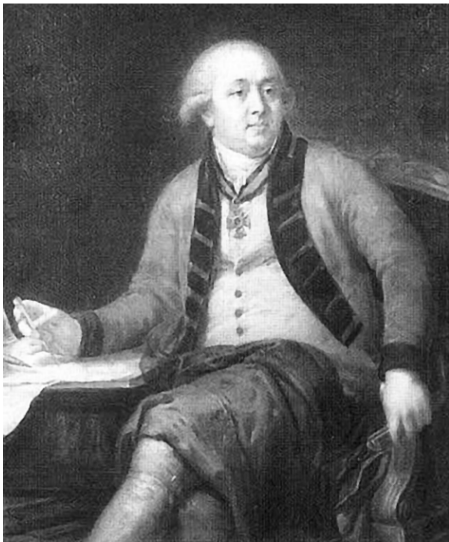
Архитектор Иван Старов

А.Г. Демидову наследовал сын Г.А. Демидов (1765–1827). Постепенно загородная резиденция Демидовых, богатейших вельмож екатерининского времени, теряла лоск и гостей. Сын Григория Александровича, а по его смерти – хозяин усадьбы в Тайцах Петр Григорьевич (1808–1862) разорился под конец жизни. В усадьбе меж тем ничего не меняли, но деревянные павильоны парка ветшали, зарастали его дорожки. В рациональном XIX веке забывался философский смысл парковых затей эпохи Просвещения. Генерал-лейтенант П.Г. Демидов разорился