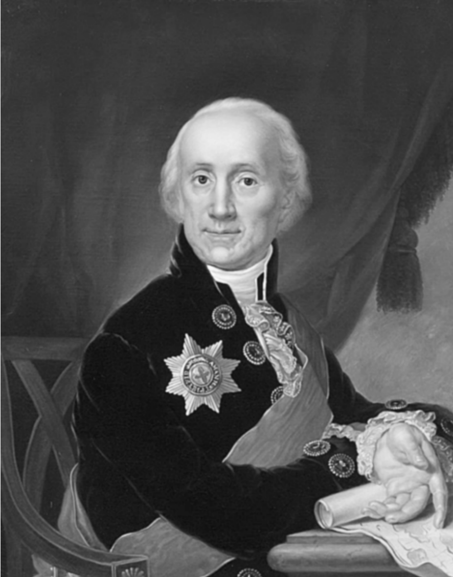
Павел Григорьевич Демидов

Практически одновременно архитектор И. Старов (1775–1808) работает в Тайцах (1774–1780) и Сиворицах (1775–1776). Места, где построены дома, а скорее, дворцы