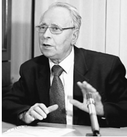
Белинский Анатолий Иванович