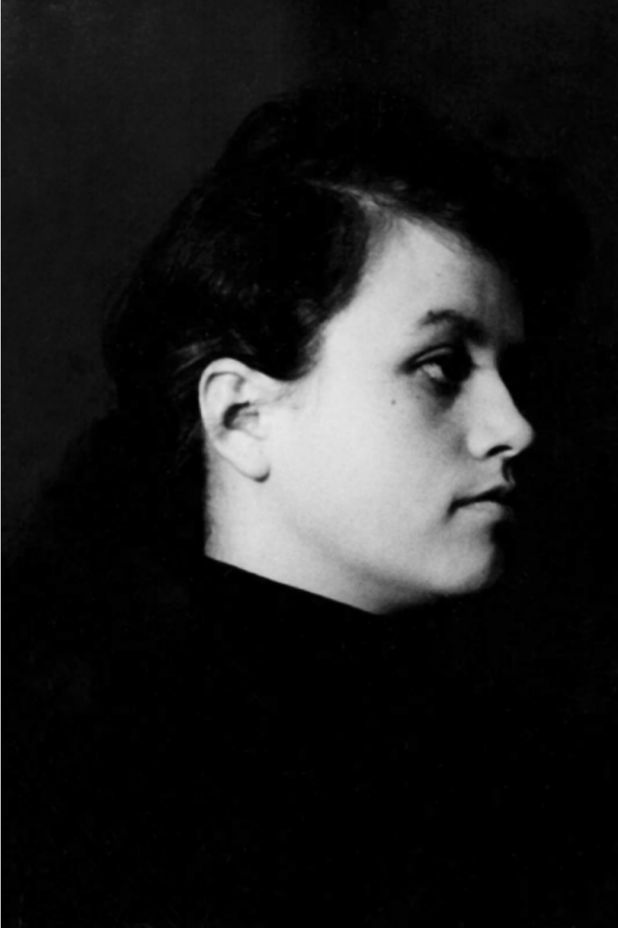
В год окончания школы в 1958 г.