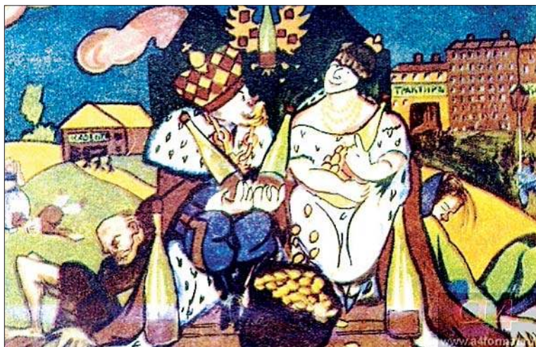
Царствование Николая Последнего. 1917