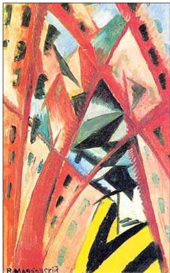
Автопортрет. Жёлтая кофта. 1918