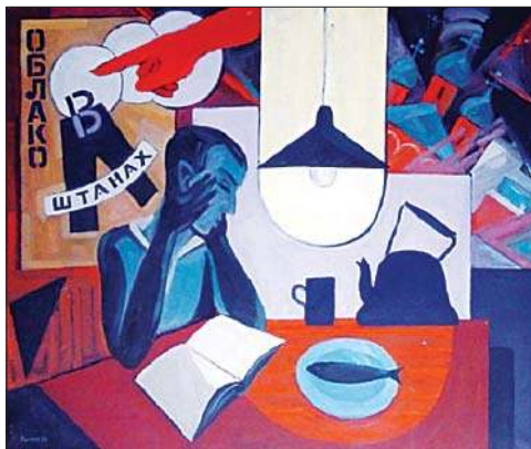
Облако в штанах