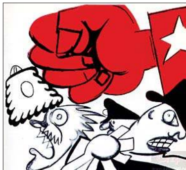
«Окно РОСТА» № 532. Фрагмент