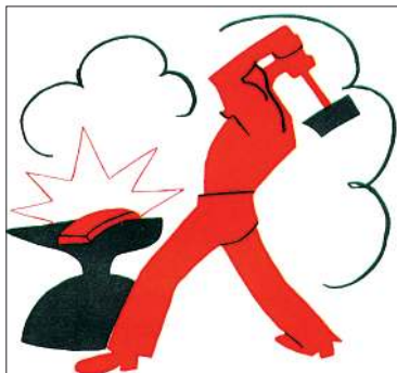
«Окно Главполитпросвета» № 143. Фрагмент