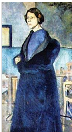
Женщина в синем. 1912–1913