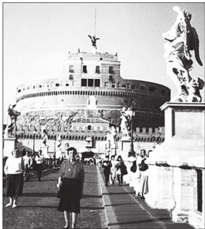
В Риме. 20.09.1997

Процветай, Вечный город. Ты ведь — радость народа. Это счастье для всех — Красота и природа.